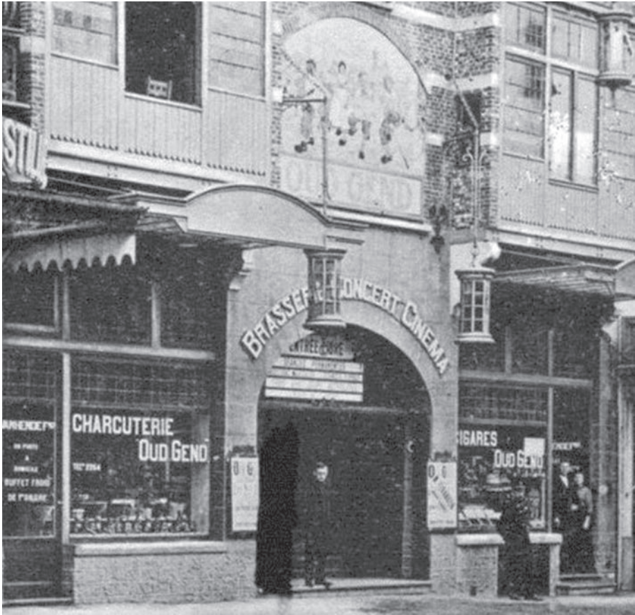
Afb. 3. Op dit detail van een andere foto uit die tijd (verz. R. Heughebaert) zien we dat de centrale entrée van Oud Gend niet enkel toegang gaf tot de cinema, maar ook tot een 'brasserie - concert'. In de charcuterie kon je terecht voor 'Buffet-froid'.

(Fragmenten uit Atmosphère à la gare terminale de Gand-Sud , vertaald uit het Frans. Zie GT 2017 nr. 2, p. 101)