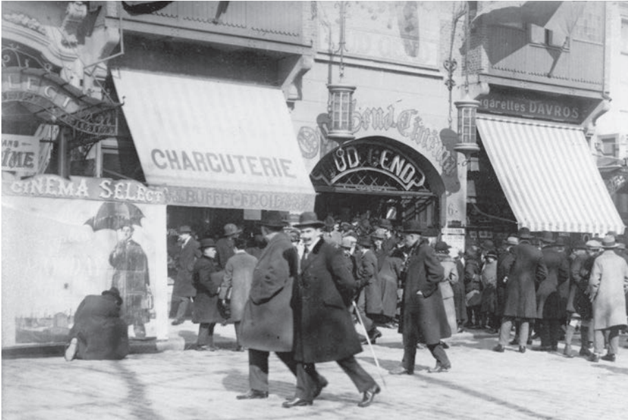
Afb. 2. Uit dit detail van een ongedateerde foto (vermoedelijk Interbellum) blijkt dat Oud Gend een multifunctioneel gebouw was: met aan de ene zijde van de cinema een winkel voor rookwaren en aan de andere een charcuterie. Uiterst links is de op de grond knielende man bezig aan de final touch op een grote reclamepancarte die tot op de verdieping zal opgehesen worden voor de komende voorstelling van de Select.

Soms, op zondagnamiddagen, trokken we met grootvader naar een filmvertoning. Aan het Zuidstation kondigden de elektrische belletjes van de twee cinema's, de Select en Oud Gend de opening van de loketten aan. De zalen stroomden vol, de mensen namen plaats op de houten banken. Maar de film-operator arriveerde altijd te laat en het ongeduldige publiek begon met de voeten in kadans te stampen op de houten vloeren. En terwijl het stof er uit vloog scandeerden ze: