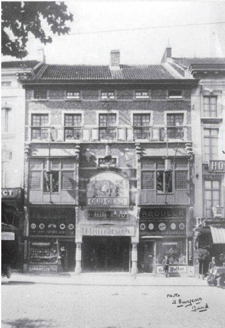
Afb. 1. De voorgevel in min of meer neo-rennaissance of eclectische stijl van Oud Gend (niet gedateerde foto). Uiterst links is nog net een stukje zichtbaar van de Select. Het centrale tegeltableau bleef bewaard in het MIAT.