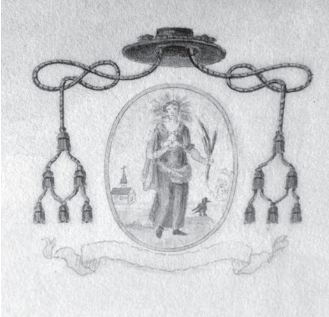
Afb. 5. Detail uit afb. 4 uitvergroot: in het medaillon: de heilige met goed herkenbare martelarenpalm en brood. Erboven: hoed en met elkaar verbonden kwasten, attriboot van het kapittel.