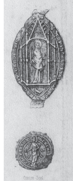
Afb. 6. Zegels van het kapittel

kerk verloren. Logisch dat het bergaf ging met de verering van de heilige. In 1611 werden in de Sint-Baafskathedraal een paar overblijfselen van de heilige Veerle teruggevonden. Ze werden aan het gelijknamige kapittel overgemaakt. Na het verdwijnen van de Sint-Veerlekerk in de loop van de zeventiende eeuw en de afschaffing van het kapittel op het einde van de achttiende eeuw, herinnerde geen enkele bidplaats nog aan de heilige, met uitzondering van de Sint-Niklaaskerk (zie afb. 1) waar het voormalig grafelijk kapittel een onderdak gevonden had. Zo geraakte ze in Gent meer en meer in de vergetelheid.