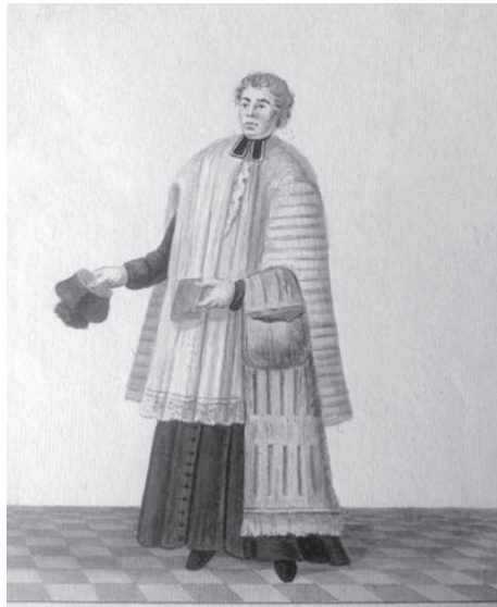
Afb. 7. Lid van het kapittel zoals die er in de 18de eeuw kon uitzien.

Plaatsen van religieus leven, Gent, p. 53-57. Met beredeneerde bibliografie. Voordeckers-Declercq M.H. (1963), Het ontstaan van de S. Veerlecultus te Gent. In: Handelingen der Maatschappij voor Geschied- en Oudheidkunde te Gent , dl. 17, p. 3-28.