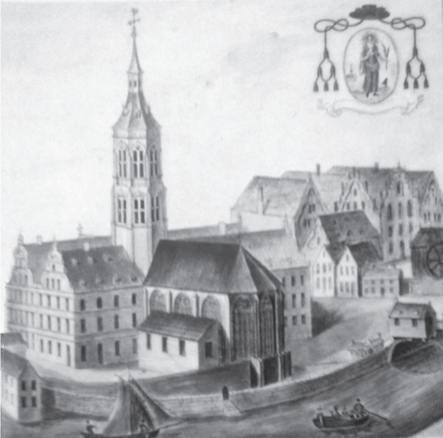
Afb. 4. Dezelfde kerk (toen ex-kerk) tien jaar later (1590, aquarel door P.J. Goetghebuer, Stadsarchief Gent, Atlas Goetghebuer L41-20, hier anders geïoriënteerd dan bij afb. 3). Het gebouw werd omgevormd tot o.m. twee grote huizen aan het Sint-Veerleplein (links). Rechts de kraan en enkele huizen van de Kraanlei.

te dagen. Op 9 mei antwoordde deurwaarder Cornelis de Cusere de keizer dat hij zijn opdracht had uitgevoerd en het Veerlekapittel tegen 20 mei had gedagvaard. De hele twist eindigde in mineur omdat de processie niet meer kon doorgaan, nadat de keizer zelf de abdij in 1540 had laten afbreken.