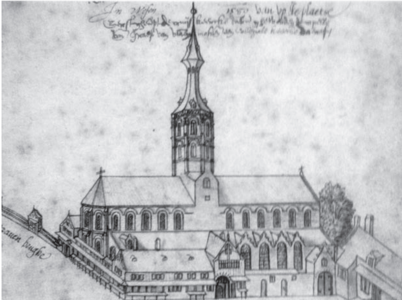
Afb. 3. De Sint-Veerlekerk kort voor de ombouw (Arent van Wynendaele, ca. 1580, Stadsarchief Gent, Atlas Goetghebuer L41-20).

stelijken die aan de burchtkapel was verbonden, vormde vanaf het begin van de dertiende eeuw het seculiere Sint-Veerlekapittel (afb. 5, 6 en 7). Sint-Veerle werd dus op twee plaatsen in Gent vereerd: in de aan haar toegewijde kapittelkerk, waar (een gedeelte van) haar overblijfselen in een schrijn werden bewaard en in de Sint-Baafsabdij, waar een ander deel werd bewaard.