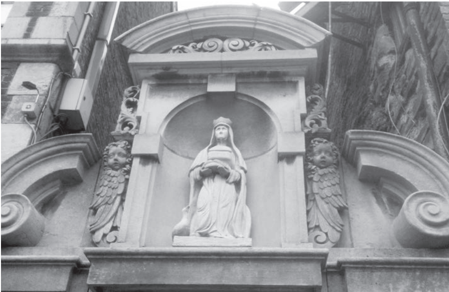
Afb. 2. Het beeldje van Sint-Veerle met een brood in haar handen en gans aan haar voeten door de dekenij Patershol geplaatst in een barok poortje, vermoedelijk afkomstig uit het afge-broken Kuldershuis aan het Bisdomplein.

Gent. In de loop van de achtste eeuw zou abt Egilfried enkele overblijfselen van de heilige naar Gent hebben gebracht. Daar werden ze aan de relieken-schat van de abdij toegevoegd en met grote zorg bewaard. Bij de Noorman-neninvall van 879-880 sloegen de Baafse kanunniken op de vlucht naar Noord-Frankrijk om zichzelf en de relieken van onder andere Sint-Veerle in veilig-heid te brengen. Pas decennia later, ca. 930, keerde een delegatie van zeven religieuzen uit Laon terug naar Gent. Vóór de restauratie van de abdijgebou-wen werden de relieken tijdelijk ondergebracht in de kapel van de grafelijke residentie in Gent, het huidige drukbezochte Gravensteen.