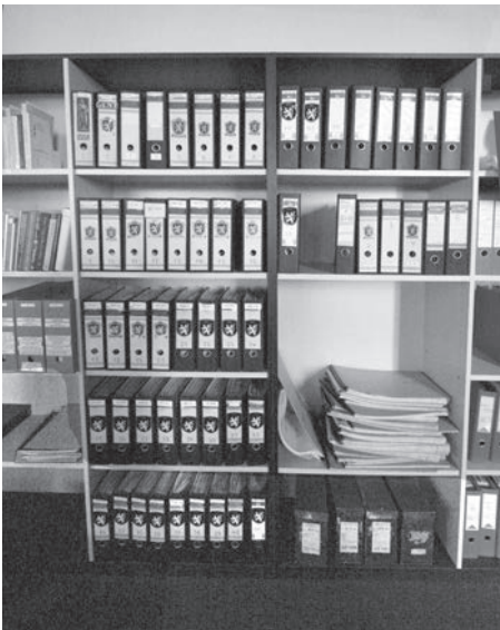
Afb. 4.

Een vraag van An Cocriamont (De School Van Toen). 'In GT jrg 33 nr 6 Dec. 2004 pag. 378 staat in de 'Gentse Memoriedagen' een korte tekst over het schooltje aan de Lucas Munichstraat, vandaag 'Het Trappenhuis' genoemd. Beschikt uw archief (DSMG) toevallig over meer info in verband met de afbraak van het oude schoolgebouw en de inhuldiging van het huidige? In het artikeltje staat dat het oude schooltje gesloopt werd in 1982. Is daar nog een bron (krantenartikel?) van te vinden in uw archief en hebt u dan ook een datum voor de inhuldiging van het huidige gebouw?' Om het antwoord te vinden staan twee documentatiecollecties ter beschikking. Onze oud-voorzitter Hugo Collumbien nam de 'Gentse Memoriedagen' voor zijn redactionele rekening en baseerde zich daarvoor op zijn uitgebreid archief, waarvan oa de