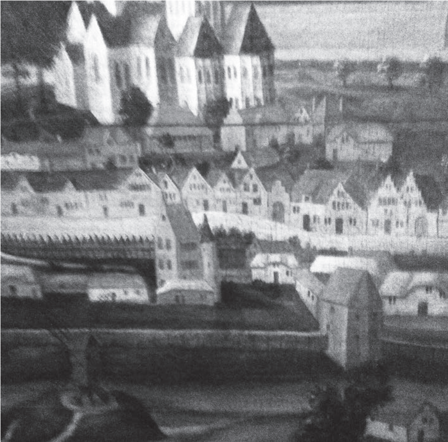
Afb. 2. Detail van het schilderij van Lucas d'Heere (1564, Bibliotheek Ugent) met het Sint-Baafsabdorp en de op het schilderij zelf aangebrachte zwarte demarcatielijn van het kasteel van Karel V. Duidelijk is te zien hoe het Nieuwhof en het grootste gedeelte van het Sint-Baafsabdorp daar buiten valt. Het kerkgebouw achterin, dat daar wel binnen valt, is de parochiekerk Sancti Christi (des Heligs Kersts – Seleskest) van het dorp. Ze werd afgebroken voor de bouw van het kasteel en moest een flink eind verhuizen naar ... wat we nu kennen als Seleskest.

eeuw op deze plek. Daarvoor, dus vóór de twaalfde eeuw, was het Hof te Slote de belangrijkste hoeve van en voor de abdij. Zij vormde de kern van de economisch en administratief-juridisch belangrijke nederzetting Slote, dichtbij het huidige Oostakker-Lourdes, een eind verwijderd van de abdij. Vooral nader in te gaan op het Nieuwhof is het daarom verhelderend eerst een beeld te schetsen van dit Hof te Slote aan de oostelijke rand van de Slote(n)kouter en zijn relatie met het Gandaklooster.