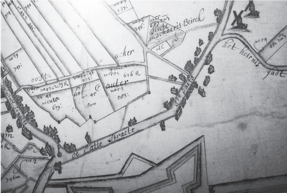
Afb. 5. De Nieuwhofkouter in 1721: drie grote blokvormige percelen tussen de weg naar Antwerpen (links onder met huizen) en de Cattedraete (onderaan, nu Dendermondsesteenweg) met nog net zichtbaar een deel van het Spaans kasteel, opvolger van de abdij. Bovenaan liggen de drie percelen tegen de opgevolde middeleeuwse vest, grens van de van de 'vryt (vrijheid) van Gent' (nu Engelbert van Arenberg- en Banierstraat). Dit was de grens met Oostakker, later Sint-Amandsberg en nu Gent 9040. In de aangrenzende zone op Oostakker, nu Begijnhof, zeven langwerpige percelen. De 'Sente Machaeris Beirch' is de locatie van de 19de-eeuwse Heilig Hartkerk. Naar de Rijksarchief Gent kaart nr. 356, zoals weergegeven in Verhulst (1995).