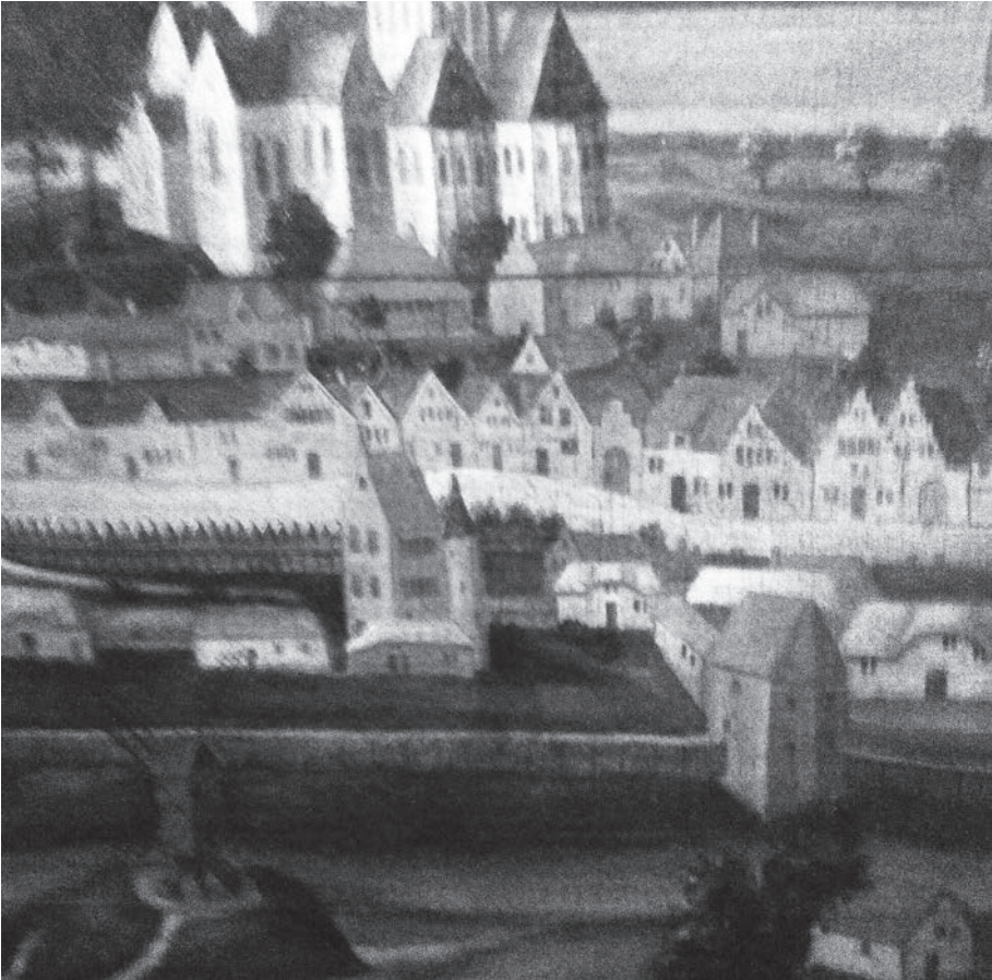
Afb. 2. Detail van het schilderij van Lucas d'Heere (1564, Bibliotheek Ugent) met het Sint-Baafsabdij en de op het schilderij zelf aangebrachte zwarte demarcatielijn van het kasteel van Karel V. Duidelijk is te zien hoe het Nieuwhof en het grootste gedeelte van het Sint-Baafsabdij daar buiten valt. Het kerkgebouw achterin, dat daar wel binnen valt, is de parochiekerk Sancti Christi (des Heligs Kersts – Seleskest) van het dorp. Ze werd afgebroken voor de bouw van het kasteel en moest een flink eind verhuizen naar ... wat we nu kennen als Seleskest.

eeuw op deze plek. Daarvoor, dus vóór de twaalfde eeuw, was het Hof te Slote de belangrijkste hoeve van en voor de abdij. Zij vormde de kern van de economisch en administratief-juridisch belangrijke nederzetting Slote, dichtbij het huidige Oostakker-Lourdes, een eind verwijderd van de abdij. Vooral nader in te gaan op het Nieuwhof is het daarom verhelderend eerst een beeld te schetsen van dit Hof te Slote aan de oostelijke rand van de Slote(n)kouter en zijn relatie met het Gandaklooster.