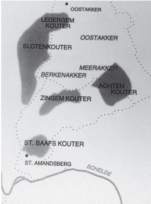
Afb. 4. Schematische voorstelling van de landbouwuitbatingen van Sint-Baafs in het oosten van Gent zoals weergegeven in Verhulst (1995, p. 164).

uit drie grote blokpercelen (ieder perceel besloeg tientallen ha): de Nieuwhofkouter, de Sint-Baafskouter en de Klinkkouter. Locatie en naam van het huidige Sint-Baafskouterpark (ca. 15 ha) en van een aanpalende straat te Sint-Amandsberg verwijzen naar één van deze blokpercelen. Verscheidene kaarten uit het ancien régime vermelden en/of tonen deze bij het Nieuwhof horende kouters (4). Daarnaast verkreeg men door drainering weiden. Zelf aangelegde weiden en kouters werden aangevuld met gekochte gronden, zodat de nieuwe hoeve over uitgestrekte landerijen beschikte. Onder abt Betto (1151-1177) herwon de abdij ook nog eens al het eerder geïsurpeerde