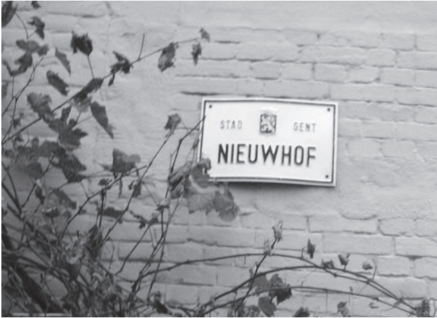
Afb. 6. Straatnaambord anno 2016.

trale abdijkas, waar ze nauwgezet werden gecontroleerd.