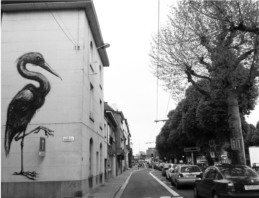
Afb. 3. Foto (2012) van de Hagelandkaai met imposante waadvogel op het hoekhuis aan de Bastionstraat, zeer herkenbaar van straatartiest ROA.