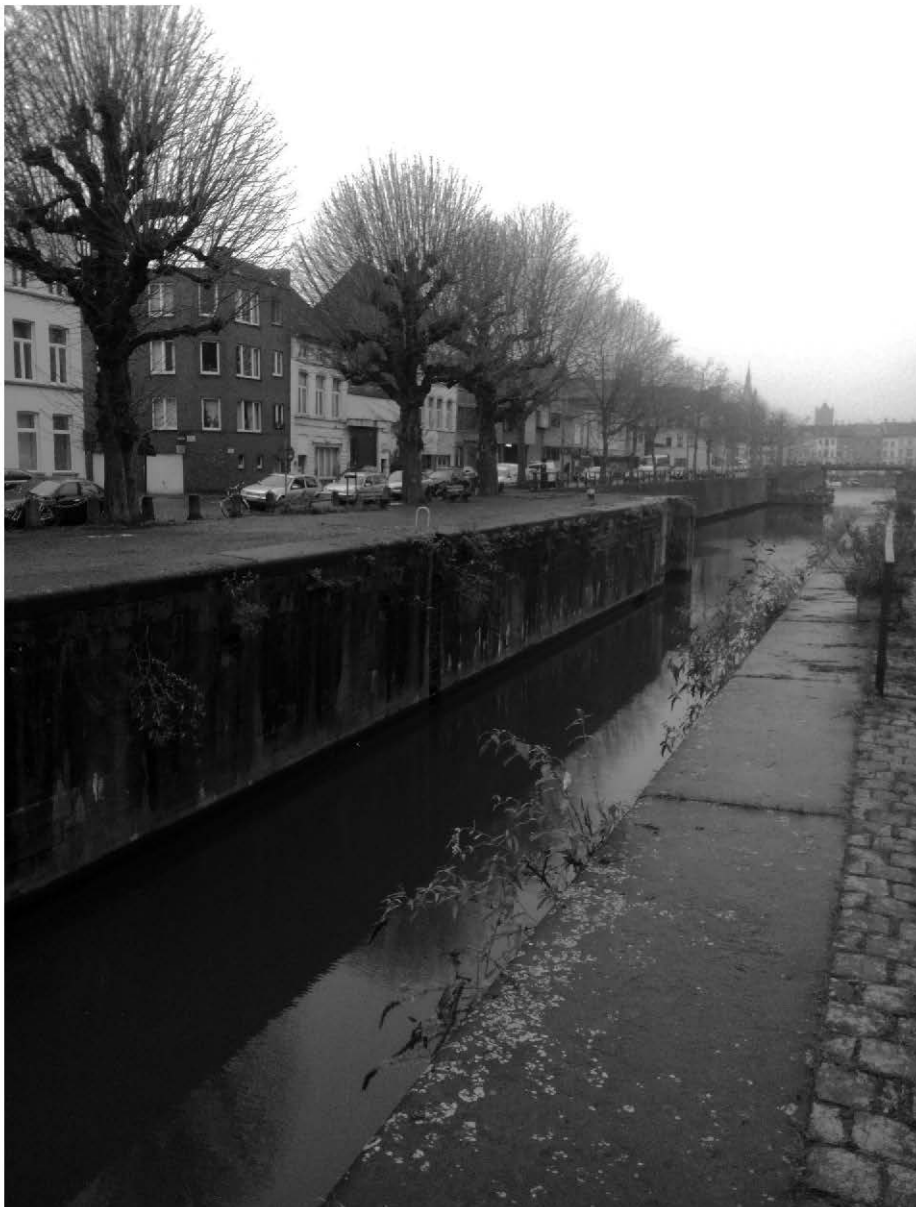
Afb. 4. De half ontmantelde Kasteelsluis in 2016.

Pauwkanaal met de Kasteelsluis, verbinding tussen 'den Dok' (Handelsdok, nu 'Oude Dokken') en wat nu Portus Ganda heet. De sluis bediende niet enkel de scheepvaart (afb. 4). Ze was ook heel belangrijk voor de regeling van de waterpeilen in het Zeekanaal en in Leie en Schelde. Dichtbij draaide het vor-