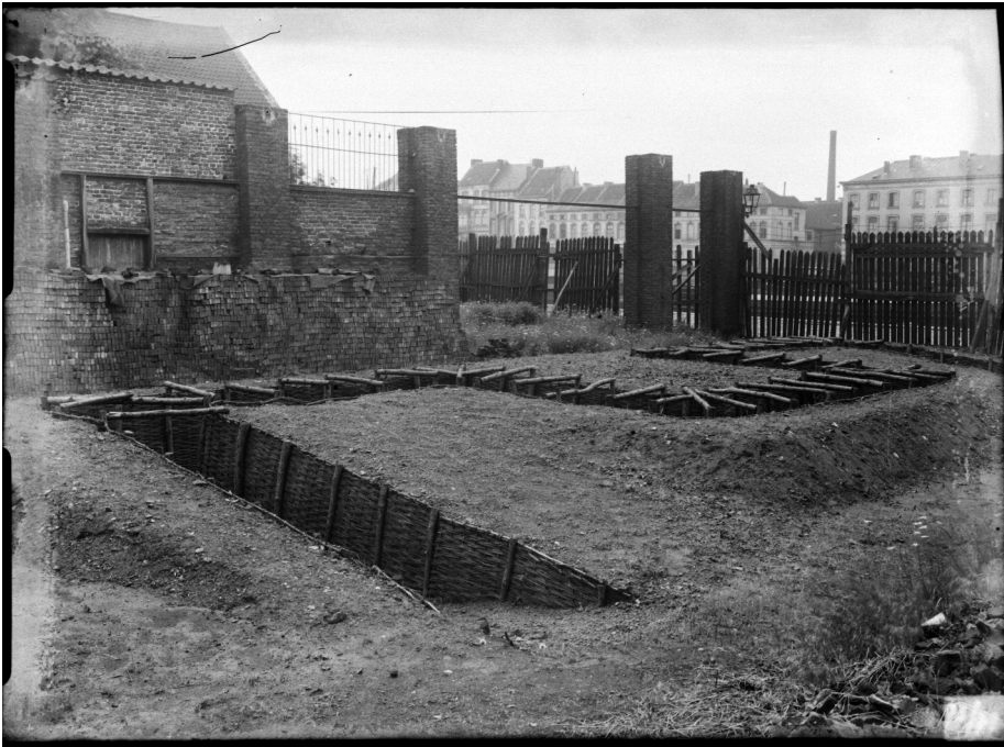
Afb. 5. Loopgrachten (tranchees) in zigzag aan het Klein Dok.

ren voor de invasie. Zo niet waren ze, gezien 't groot getal slachtoffers, volstrekt misdadig.