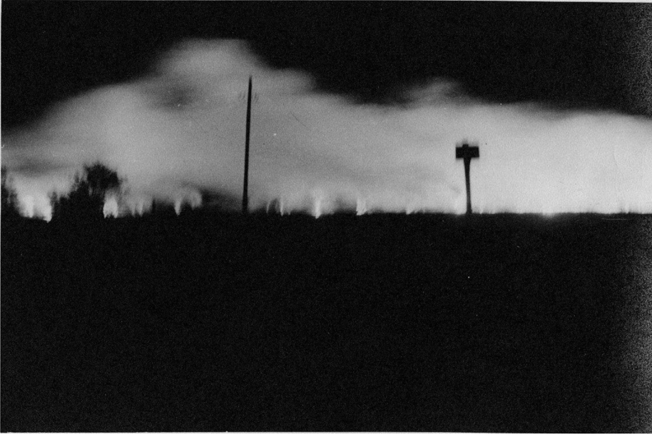
Afb. 6. Brandbommen verlichten de nacht.

Toen het geknetter dichter leek te komen zei vader in zenuwachtige ontredde- ring: “Nu komen ze naar ‘t Champ de Manoeuvre” (2). Waarop we weer in de kelder gingen schuilen. Maar “t ergste was voorbij. Nog verwijderend moto- rengeronk, de rode schijn verdween. Moeder houdt vol op de kamer een eigenaardige solfer - zwavelachtigen geur te hebben waargenomen. Omdat we eigenlijk geen gedaver als van zware bommen hadden gevoeld of gehoord, gingen we slapen in de mening dat de schade niet al te erg kon zijn. ‘s Ande- rendaags echter vernamen we dat het dodenaantal in de honderden liep.