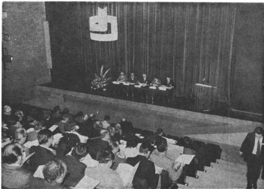
Een blik op de congreszaal tijdens de technologisch-economische werkdag.

en research, het experiment moeten helpen voorbereiden en het begeleiden.