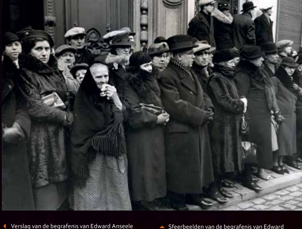
Verslag van de begrafenis van Edward Anseele in Voort, 22 februari 1938.