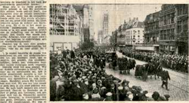
De begrafenis van Edward Anseele op het kerkhof van Bathazar.

De begrafenis van Edward Anseele, die op 21 februari 1938 overleed, werd een van de grootste begrafenisfeesten van België. De begrafenis van Edward Anseele, die op 21 februari 1938 overleed, werd een van de grootste begrafenisfeesten van België.