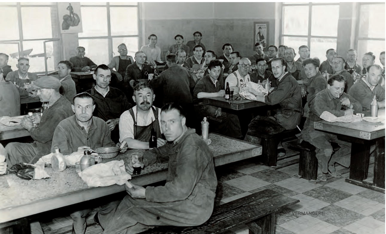
Arbeiders in de eetzaal in de Mercantilewerkhuisen tijdens de jaren 1940.

Het verzamelen van verhalen is niet alleen nodig om (ex-)werknemers actief bij dit project te betrekken, maar is ook essentieel om meer kennis te verwerven over de schafttijd. Daarom organiseerden we crowdsourcingmomenten met verschillende partners om