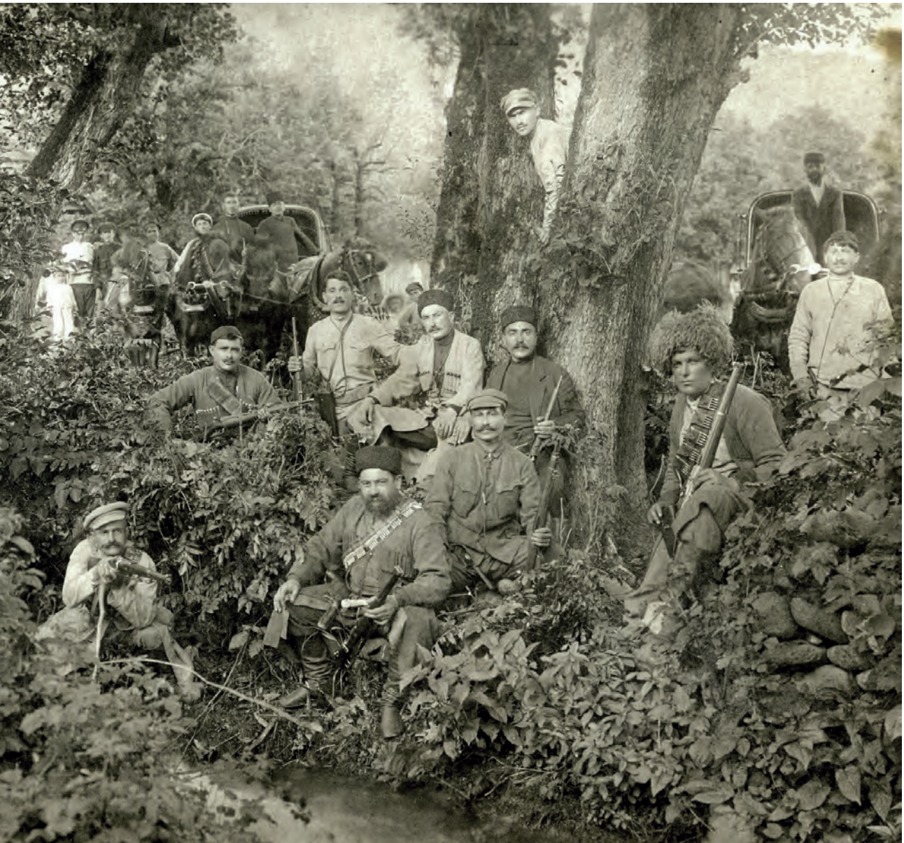
Georgische partizanen die vanaf 1921 een guerilla-oorlog voerden tegen het bolsjewistische regime. (Geschiedenis van Georgië - Wikipedia)