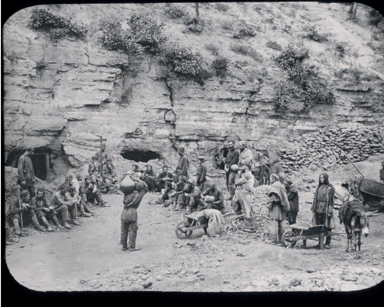
Mijnwerkers tijdens hun pauze in Tchiatura.

ten opnieuw enkele zuidelijke districten van Georgië op. De Brouckère deed een oproep: Georgië zat geklemd tussen het Rode en het Turkse leger en het kon zich niet verdedigen als de grootmachten, die het land erkenden, niet ter hulp kwamen. 98 Maar op 25 maart berichtten de socialistische kranten dat de Georgische regering het land had verlaten aan boord van een Italiaans schip. Nu was voor iedereen duidelijk dat het afgelopen was.