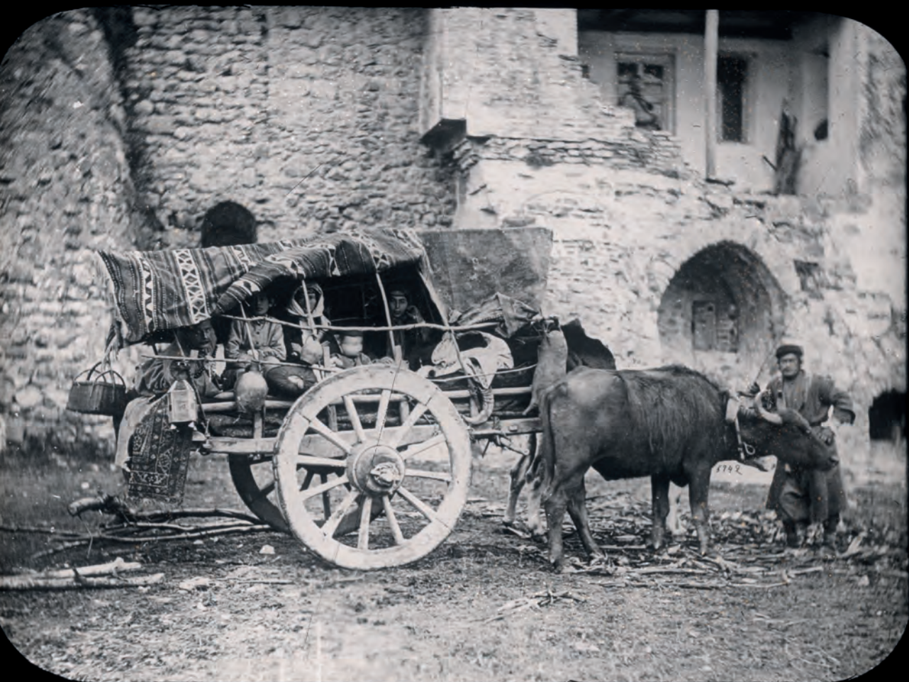
Familietransport met een arba (ossenwagen).

moerassen droog te leggen en het landbouwareaal uit te breiden. 77 De staat had ook het voorkeurrecht bij de verkoop van een grond, waardoor de vrije markt van gronden verdween. Volgens auteur Eric Lee was er wel een zwarte markt van gronden. 78