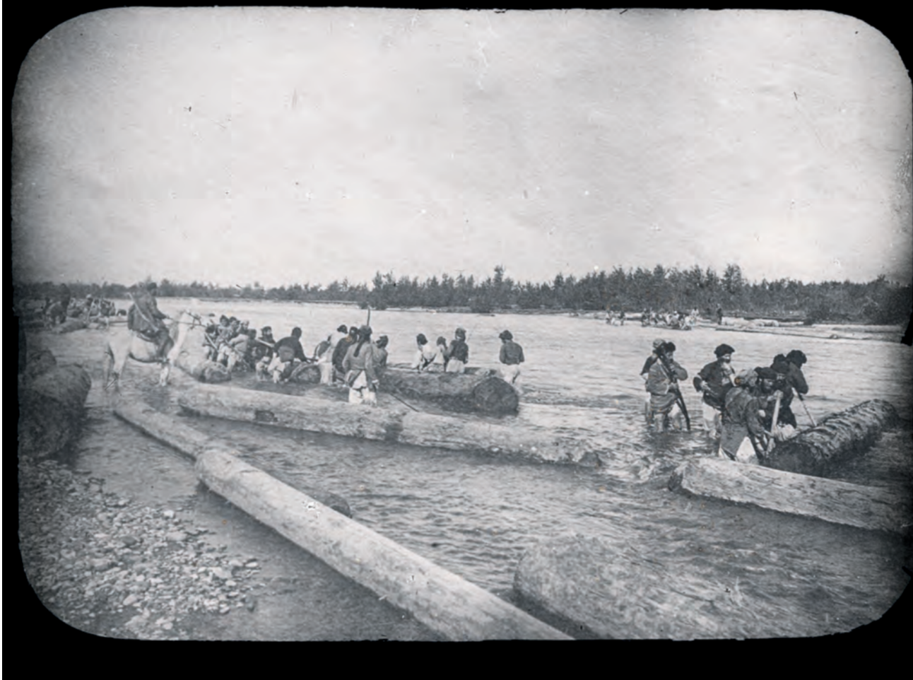
Houttransport op een rivier.

Woytinsky betaalden de boeren vanaf toen de pacht met 5 à 10 procent van de oogst. Maar veel pacht zal er waarschijnlijk niet betaald zijn. De confiscatie en (her)verdeling van de duizenden gronden liep niet overal even vlot en was zelfs nog niet afgerond in februari 1921.