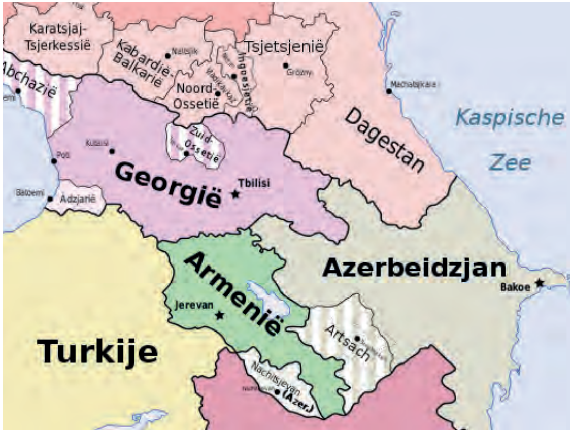
Geopolitieke kaart van de Kaukasus, 02/09/2008. ( https://nl.wikipedia.org/wiki/Kaukasus_(gebied) )

onder de laatste tsaren een verbanningsoord, waar liberale dissidenten hun ideeën verkondigden. 3 Toen de eerste groepjes marxisten gevormd werden, stonden ex-seminaristen 4 aan de leiding, met onder hen Noé Zjordania 5 en Niko Tsjcheidze 6 .