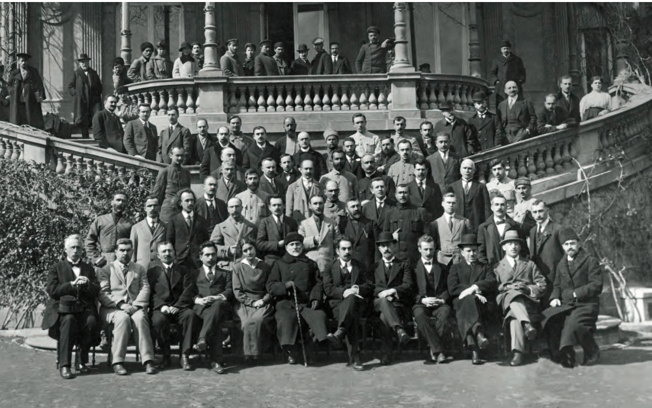
De Grondwetgevende Vergadering van Georgië, 1918. (National Archive of Georgia)