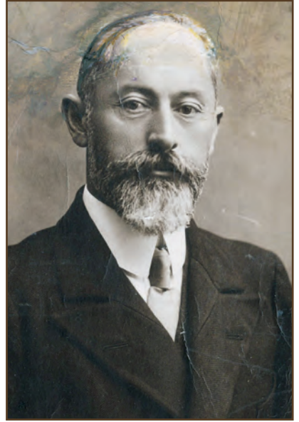
Drie hoofdrolspelers in de geschiedenis van Georgië begin 20e eeuw. V.l.n.r.: Irakli Tsereteli, Niko Tsichidze en Noé Zjordania.