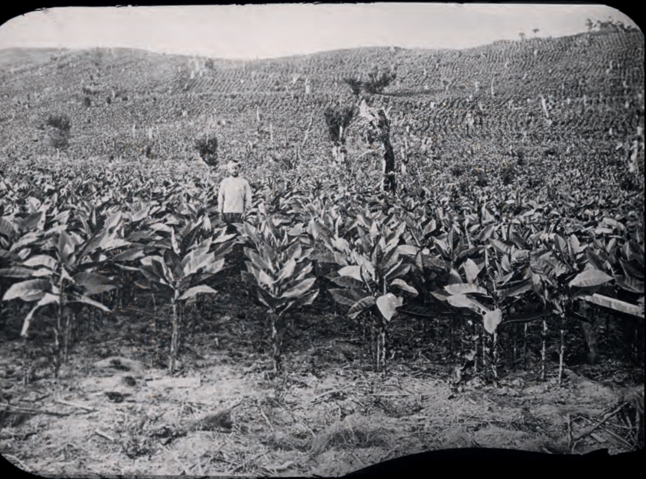
Tabaksplantage in Batoemi.

naar de ontwikkelingen in de landbouw in Rusland en Georgië.