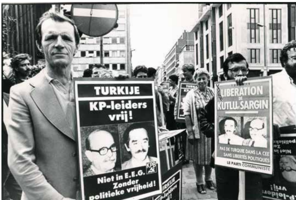
Actie van de KPB voor de vrijlating van Turkse communistische leiders die bij hun terugkeer uit ballingschap in 1987 werden opgesloten.

Hoewel de communistische partij vooral een Franstalig/Brussels gegeven is, was ik ook blij verrast dat de auteurs taalsgewijs naar een meer dan gezond evenwicht in de beelden hebben gestreefd. Ook dat verdient een pluim.