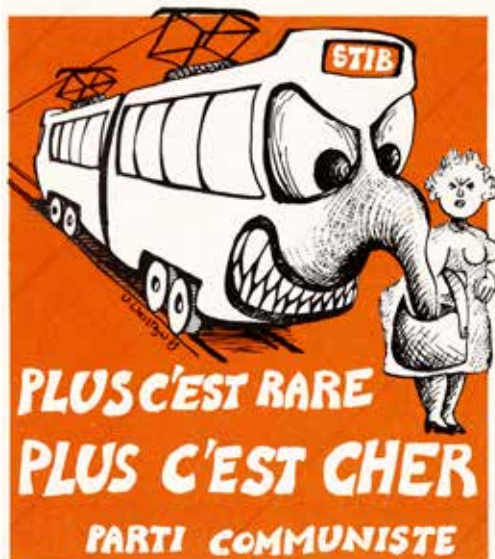
Affiche van de PCB met een oproep tot goedkoper openbaar vervoer, 1980. Ontwerp: Willy Wolsztajn (CArCoB, Brussel)