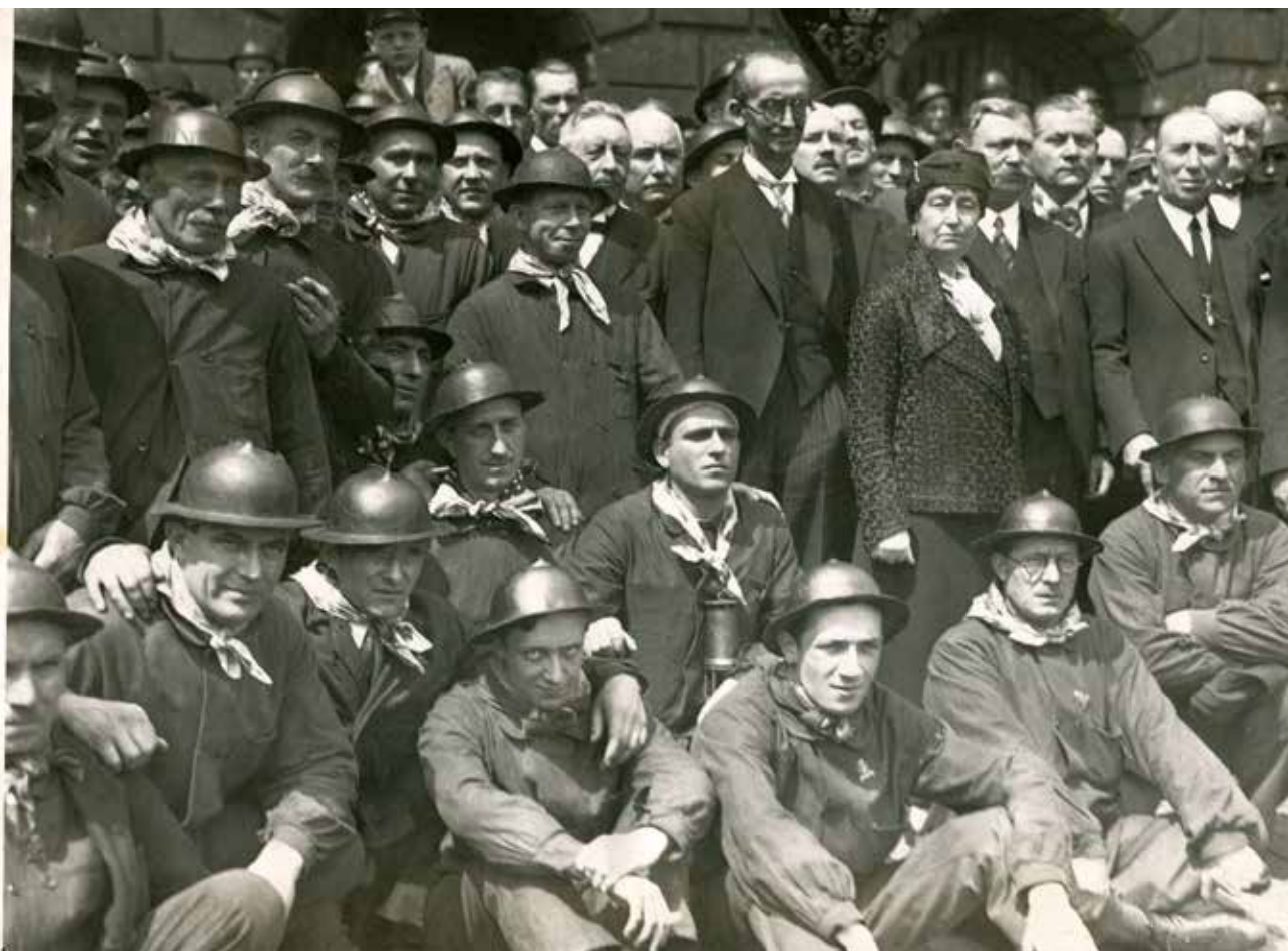
Burgemeester Camille Huysmans ontvangt een groep mijnwerkers op het stadhuis van Antwerpen, 1934.