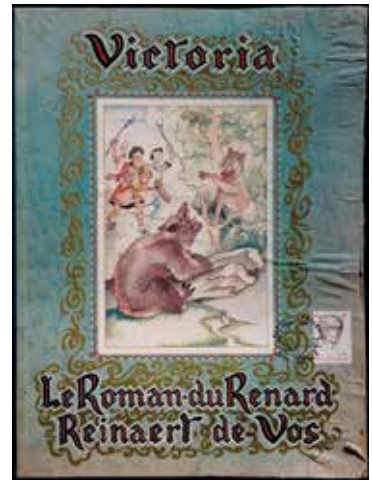
Covers van enkele boeken uit de bibliotheek van Camille Huysmans.