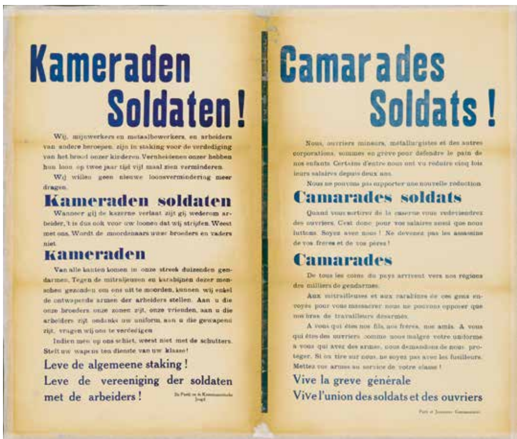
Affiche uitgegeven in 1932 door de Kommunistische Partij van België en de Kommunistische Jeugd van België voor solidariteit met de mijnwerkers in de Borinage. (Amsab-ISG, Gent)

een 'staat van beleg'. (Schepen!) Balthazar trad hem meteen bij. Een zeldzaam geval van eensgezindheid en dit bij de aanvang van een zitting waarin Balthazar en de BWP de schietschijf zouden zijn.