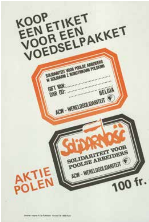
Affiche van ACW-Wereldsolidariteit met een oproep tot steun aan de Poolse vakbond Solidarność, begin jaren 1980.

Een andere pool van de internationale solidariteit in België was Oost-Europa. Ook hier maakte het verzet tegen het imperialisme deel uit van de motivatie, maar was het gericht tegen de Sovjet-Unie. In de context van de Koude Oorlog wou de USSR immers haar invloed in het oosten van het oude continent handhaven. Al in 1956 had de onderdrukking van de opstand in Boedapest door Sovjettroepen tot verontwaardiging in West-Europa geleid. Hetzelfde geldt voor het neerslaan van de Praagse Lente, twaalf jaar later. Ook de stakingsgolf onder leiding van de vakbond Solidarność in Polen in het begin van de jaren 1980 kreeg steun in het Westen, met name in België, vooral na de afkondiging van de staat van beleg eind 1981.