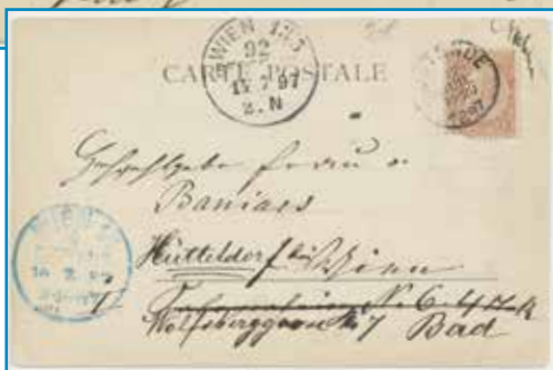
Boven: De prentbriefkaartenindustrie speelde gretig in op het groeiende toerisme. Kaart van de Duitse uitgever Römmler & Jonas, ca. 1897.