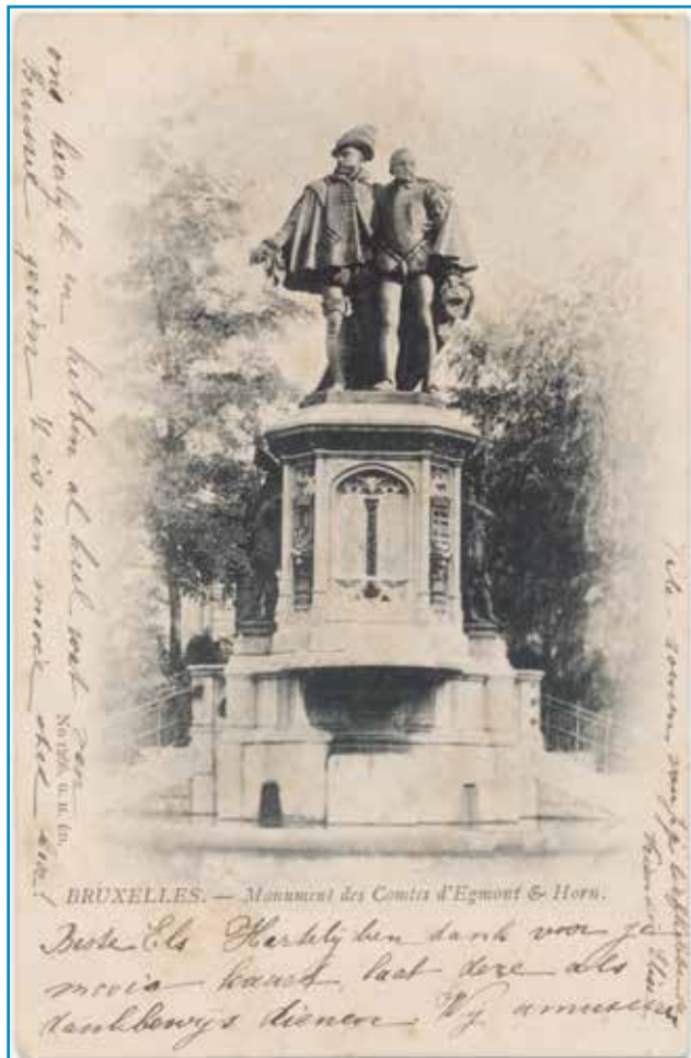
Ook standbeelden werden op prentbriefkaarten afgebeeld. (Privécollectie Constandt-Bloes)

Ook monumentenzorgers en bouwhistorici vinden in de prentkaarten een gedroomde bron. Er zijn echter twee restricties: huizen in kleine gemeenten of in minder gegeerde straten in steden haalden dikwijls de prentbriefkaart niet. Ook bestaat het gevaar dat afbeeldingen op kaarten om commerciële redenen gemanipuleerd werden. Hotels die niet