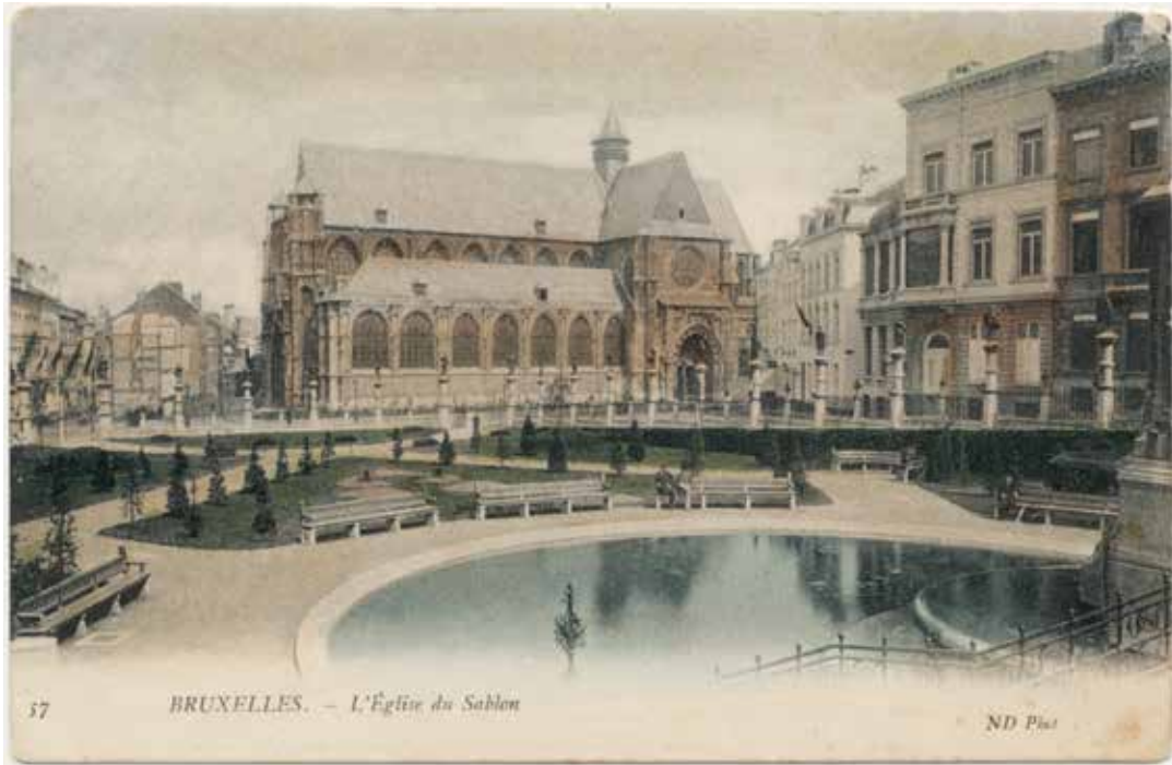
Handgekleurde prentbriefkaart van de Franse uitgever Nurdein met een afbeelding van de kerk op de Zavel in Brussel, ca. 1906.

woordigers. De Brusselse uitgever Marco Marcovici maakte van deze groep een prentbriefkaart die moest aantonen hoe succesvol ze waren. Een van deze verkopers werd zelfs op een kaart van Nels afgebeeld. 6 Bij een vergelijk moesten de gegevens worden bezorgd. Een goede foto was uiteraard onontbeerlijk en werd door de klant of door de uitgeverij geleverd. Nels beschikte bijvoorbeeld over fotografen die deze klus konden klaren.