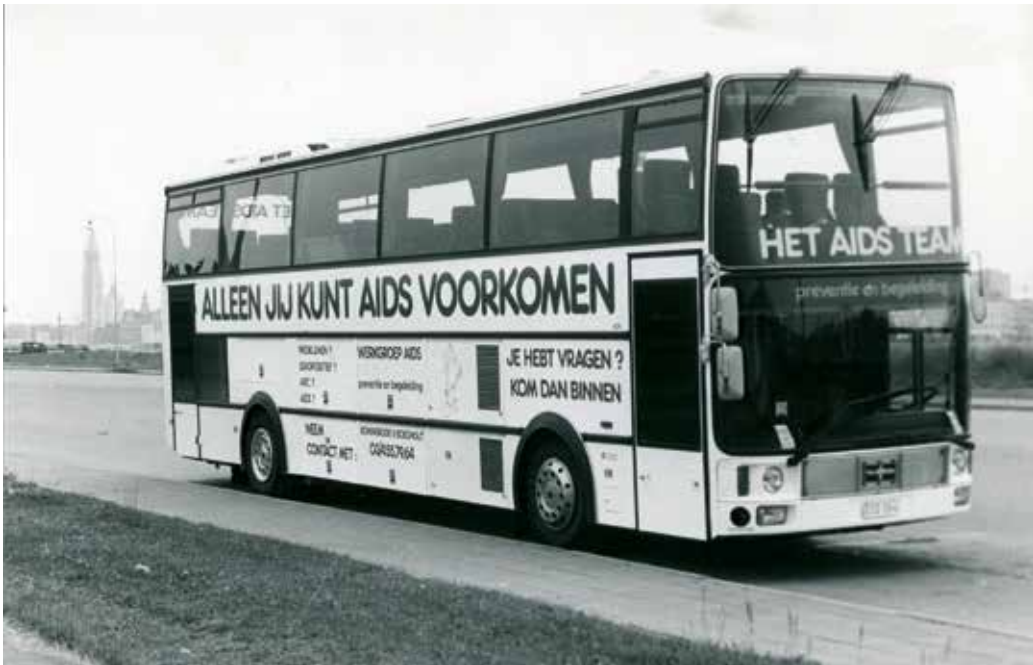
Van 1987 tot eind 1989 trok Het Aidsteam met de aidsbus naar markten, braderijen, festivals en andere evenementen in zowat alle Vlaamse gemeenten.

met de medicijncocktails (sinds 1996) de levensverwachting en -kwaliteit van mensen met hiv aanzienlijk. Vooral in het Westen had dit een belangrijke impact op het karakter van de ziekte: hiv/aids was en is niet langer automatisch een doodvonnis. 'Sterven aan aids' evolueerde naar 'leven met hiv'. Onder meer daardoor kreeg de preventie steeds complexere vormen, waarbij de boodschap werd genuanceerd – realistischer gesteld – en vertaald naar specifieke subgroepen: mensen met hiv, personen met een vaste relatie ... Preventie werd maatwerk, de preventiewerkers probeerden rekening te houden met de vele leef- en betekeniswerelden van homoseksuele mannen, met de complexiteit van de seksuele praktijk en met de evolutie in de tijd. Tevens groeide de aandacht voor andere soa's.