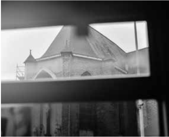
Een foto van de kerk waar Angelo alleen voor het altaar was blijven staan. Het was een gevoelig en persoonlijk verhaal dat we toevallig 'tegenkwamen' toen we, op weg naar de plek waar het interview zou plaatsvinden, voorbij de kerk reden met de tram.