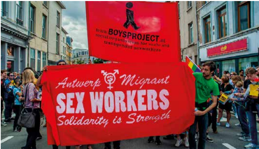
Boysproject tijdens de Pride in Antwerpen, augustus 2019.