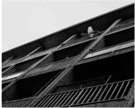
Terwijl we met een van de gasten onderweg waren naar haar 'window of memory', kwamen we voorbij dit gebouw. Haar humeur veranderde toen ze vertelde hoe ze hier ooit had geleefd en hoe ongelukkig en onveilig ze zich hier had gevoeld.

Sommige gesprekken leken heel vlot te lopen, waardoor we te enthousiast werden in het stellen van onze vragen. Dat zorgde dan soms voor een terugslag in de kwaliteit van het interview. Vragen zoals 'hoe zou je jezelf beschrijven?', 'hoe voel je je daarbij?' of 'hoeveel verdien je?' kregen daardoor niet altijd het gewenste antwoord. Zo liep het gesprek met Henk aanvankelijk vast omdat we te snel vragen stelden over 'hoelang hij dit werk al deed' en hoe hij 'contact had met zijn klanten'. Die momenten brachten ons uit evenwicht. We wilden geen indringers zijn in het leven van een onbekende die het zonder onze aanwezigheid al zwaar genoeg heeft. Plan B dan maar. Als iets niet werkt, moet je iets anders proberen. Dat leerden we ook bij de theoretische lessen van service-learning. Daarom zetten we na de eerste reeks interviews 'windows of memory' in, een courante methode bij mondelinge geschiedenis. Foto's of andere materiële sporen van het verleden kunnen de geïnterviewde prikkelen om over vroegere situaties te vertellen. Ze volgen daarmee hun eigen perspectief en doen hun verhaal vanuit hun vroegere 'ik'. 32 We vroegen de gasten ons