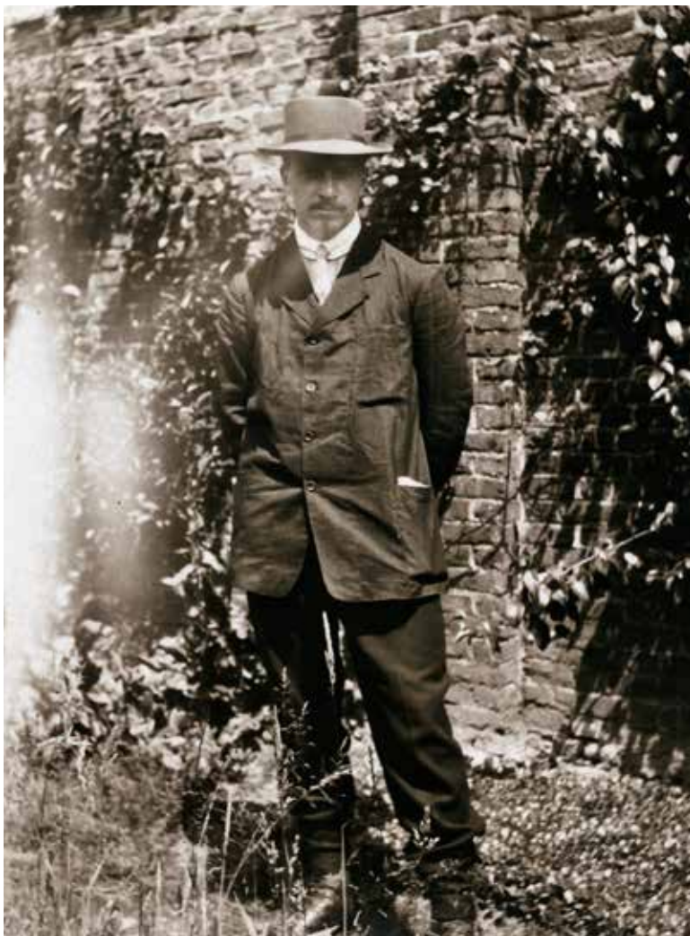
Hendrik De Man in Gent op 17 juni 1910.

Deze biografie laat zien dat De Man in veel opzichten buiten de lijntjes van het reguliere klassieke Belgische reformisme kleurde. Opvallend in dit opzicht is de afwezigheid van antiklerikalisme, toch een kenmerk van de Belgische sociaaldemocratie. Dit boek laat zien dat De Man in nauw contact stond met veel katholieken, vooral met katholieken uit extreemrechtse hoek, niet met de christelijke arbeidersbeweging. Dit was in overeenstemming met de algemene politieke oriëntatie van De Man. Hij rekende niet