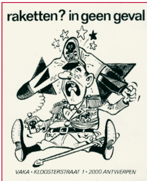
Sticker van VAKA die werd uitgedeeld in het kader van de campagne 'Raketten? in geen geval'.

kleur wilde doen bekennen. Om de campagne om te zetten in publiek protest plande VAKA een nieuwe nationale betoging, die zou doorgaan op 23 oktober 1983. 53 Een eerste barst in de strategische opvattingen van de IOT en VAKA ontstond toen het OCV als coördinerend orgaan een voorlopige versie van de platformtekst voor de betoging uitrolde. De tekst ging uit van de onvoorwaardelijke afwijzing van de raketten. Door zijn connecties met de CVP was het ACW het niet eens met dit radicale standpunt. Daarom stelde het voor om in plaats van de onvoorwaardelijke afwijzing de tijdelijke opschorting van het plaatsingsbesluit te eisen, een gematigder stellingname. VAKA, die het ACW met zijn grote achterban absoluut binnen zijn rangen wilde houden, wijzigde daarop de platformtekst, wat op onbegrip en wantrouwen van de IOT stuitte. 54