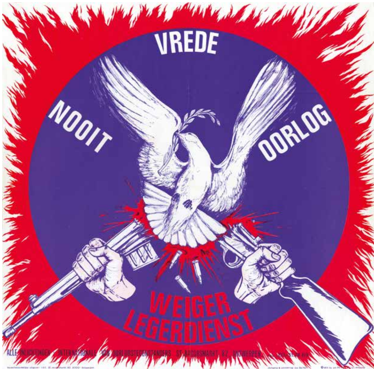
Dienstweigering was de rode draad in de werking van de jonge Internationale van Oorlogstegenstanders (IOT). Affiche uitgegeven in 1973 door de IOT. Ontwerp: Roland Georges 'Jos' De Hert (Grapjos) (Amsab-ISG, Gent)