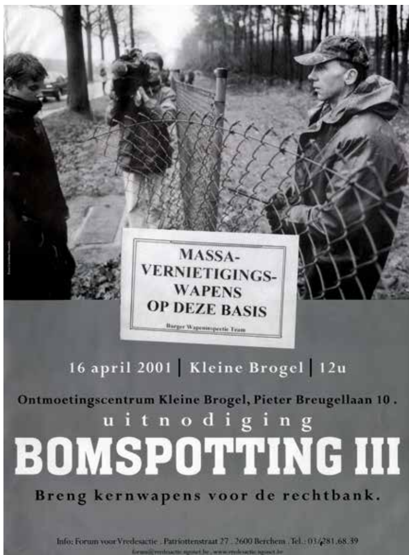
Affiche uitgegeven in 2001 door het Forum voor Vredesactie voor de campagne Bomspotting tegen kernwapens.

maar van burgeroorlogen en andersschalige conflicten. In de geglobaliseerde wereld waarin we vandaag leven, probeert Vredesactie ingewikkelde, grootschalige dossiers zoals wapenhandel, kernwapens en nieuwe conflictsituaties te vertalen in concrete actiepunten, die op regionaal en nationaal niveau aangepakt kunnen worden. 76 Het geweld in de wereld is sinds 1989 allesbehalve verminderd. Vredesorganisaties dienen hierop nog