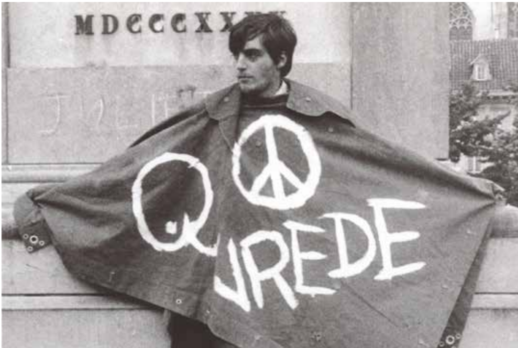
De provobeweging droeg vrede hoog in het vaandel. Beeld uit een provohappening in Antwerpen in 1969.

strijdpunten. Vanaf de wettelijke erkenning in 1965 tot 1973 was het aantal gewetensbezwaarden in Vlaanderen van 11 naar 535 gestegen. 15 Deze exponentiële toename liep dan ook gelijk met de toenadering van jongeren tot de IOT. 16 Naast de atoommarsen en de strijd tegen het Belgische lidmaatschap van de NAVO en de Vietnamoorlog streed de IOT mee voor de rechten van gewetensbezwaarden. Die kregen het regelmatig zwaar te verduren tijdens hun alternatieve dienst. Tot de wet van 22 januari 1969 bestond die enkel uit ongewapende dienst in het leger of in de civiele bescherming. Na januari 1969 konden mensen die de ongewapende dienst of de civiele bescherming te nauw verbonden vonden met het militaire apparaat, hun burgerdienst