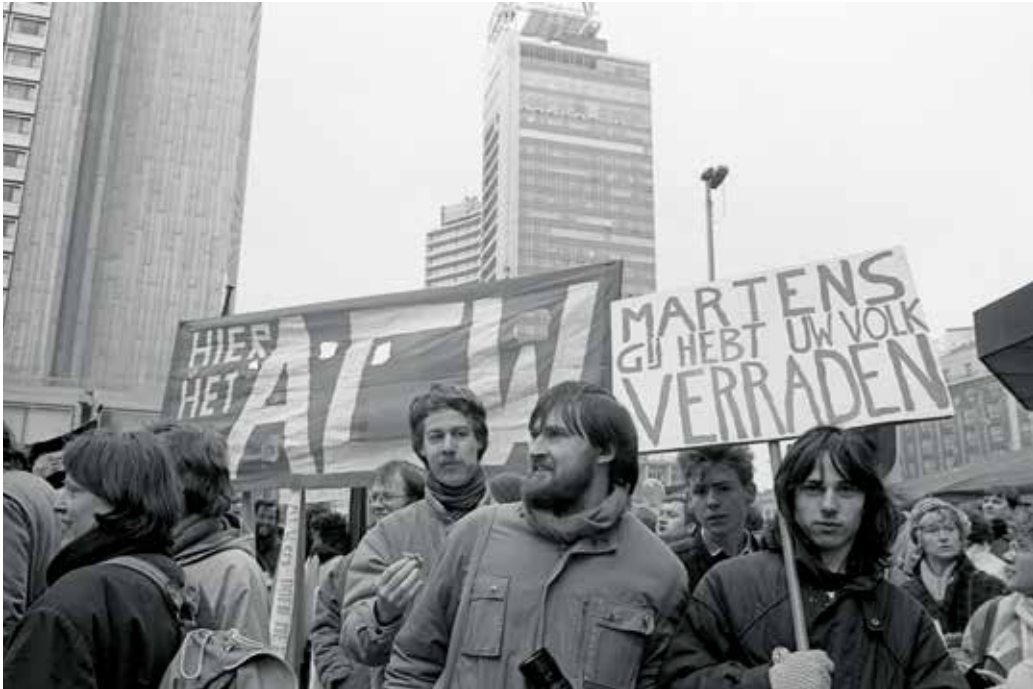
Een ACW-delegatie op de antirakettenbetoging van 1985 in Brussel.

gen. De IOT had voor de uitwerking van dit idee zelfs een belastingconsulent onder de arm genomen, die het al dan niet strafbare karakter van dit actiemiddel diende uit te pluizen. Niet betalen omwille van morele of politieke motieven viel voor de fiscus onder dezelfde categorie als niet betalen omwille van geldgebrek, wat het geen strafrechtelijk feit maakte en het onderscheidde van fraude en fiscale subversie. 59