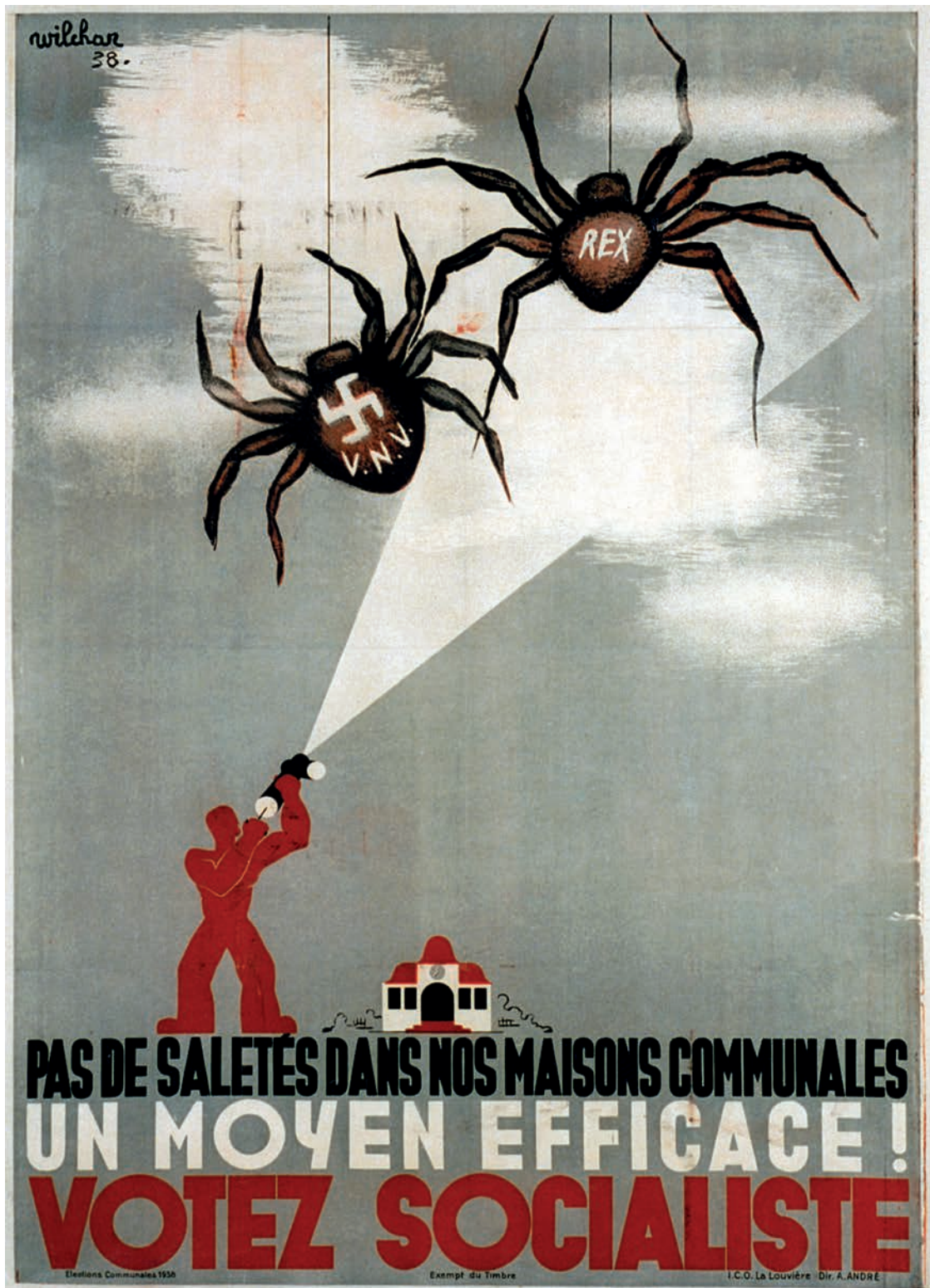
Affiche van Wilchar uitgegeven door de Parti Ouvrier Belge (POB) voor de gemeenteraadsverkiezingen van 1938. (Amsab-ISG, Gent)