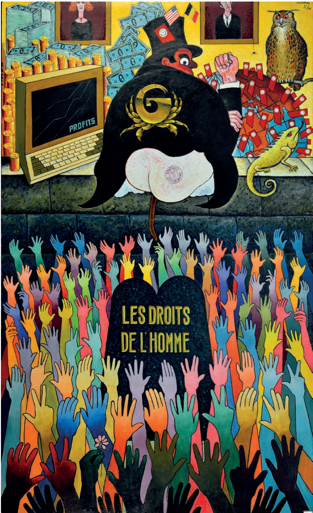
Les droits de l'homme, een schilderij van Wilchar, 1990.