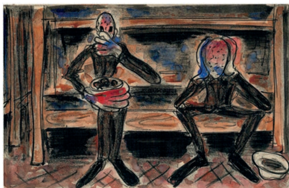
Na de oorlog maakte Wilchar over zijn ervaringen in Breendonk een aangrijpende reeks aquarellen, die hij omzette in litho's en die in beperkte oplage werden uitgeven door de Editions Baguette.

onderscheidde Wilchar zich meteen van de doorsnee-afficheontwerper.