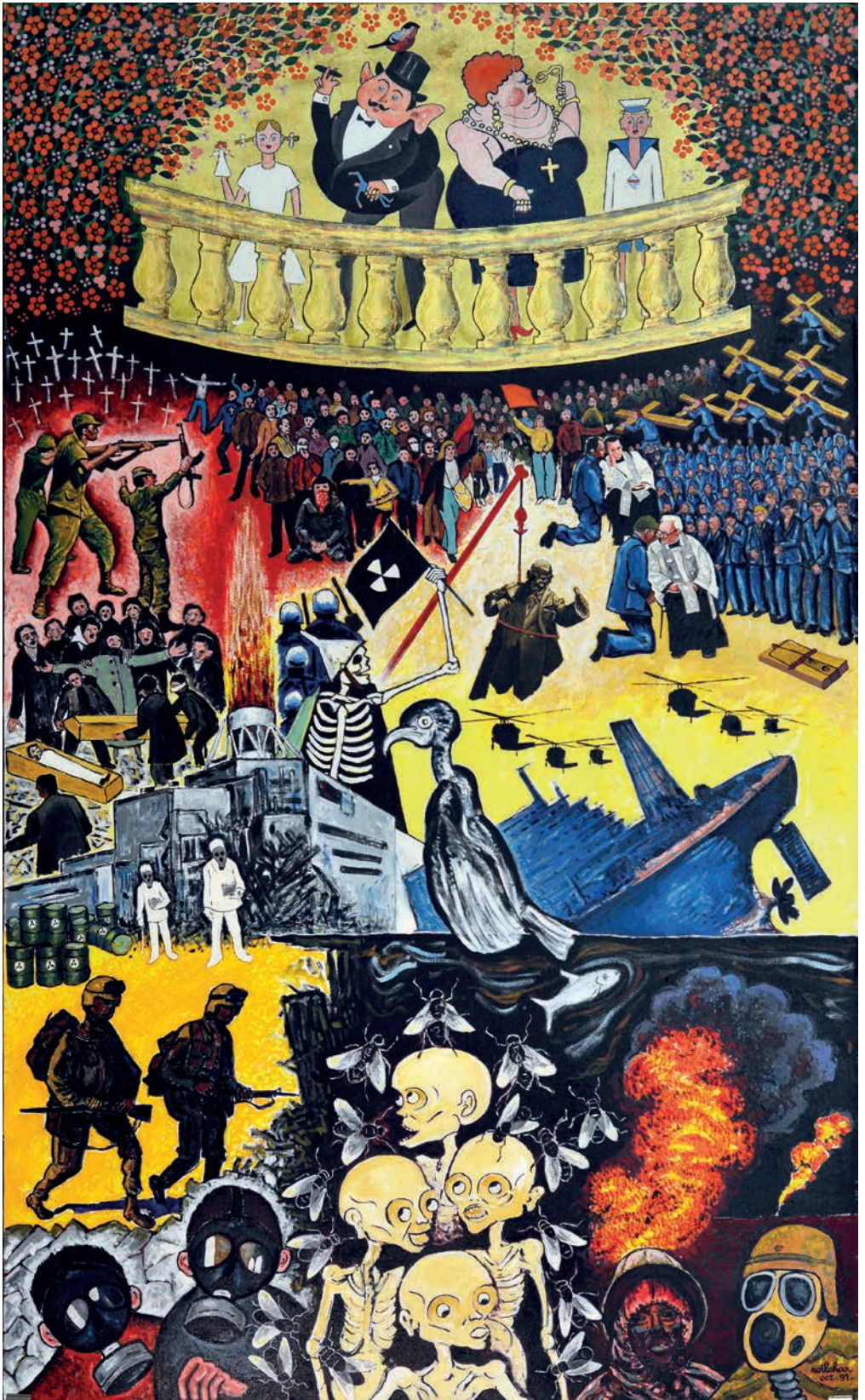
Le Balcon, een schilderij van Wilchar, oktober 1991.