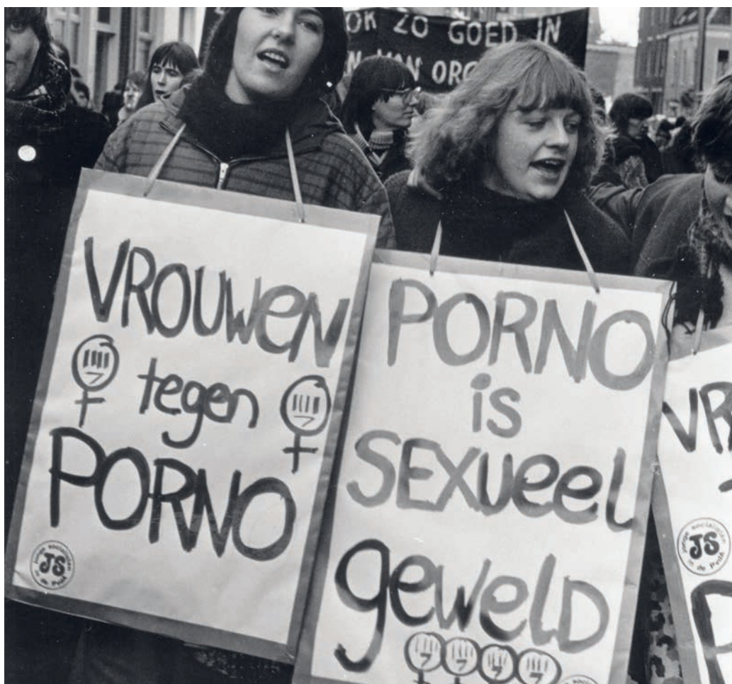
Demonstratie in Nijmegen in 1981. De aanleiding was een proces tegen twaalf vrouwen die waren gearresteerd omdat ze actie voerden tegen het openen van een pornobioscoop. De demonstranten wilden dat het proces geen aanklacht werd tegen vrouwen, maar wel tegen porno en tegen het geweld door mannen.