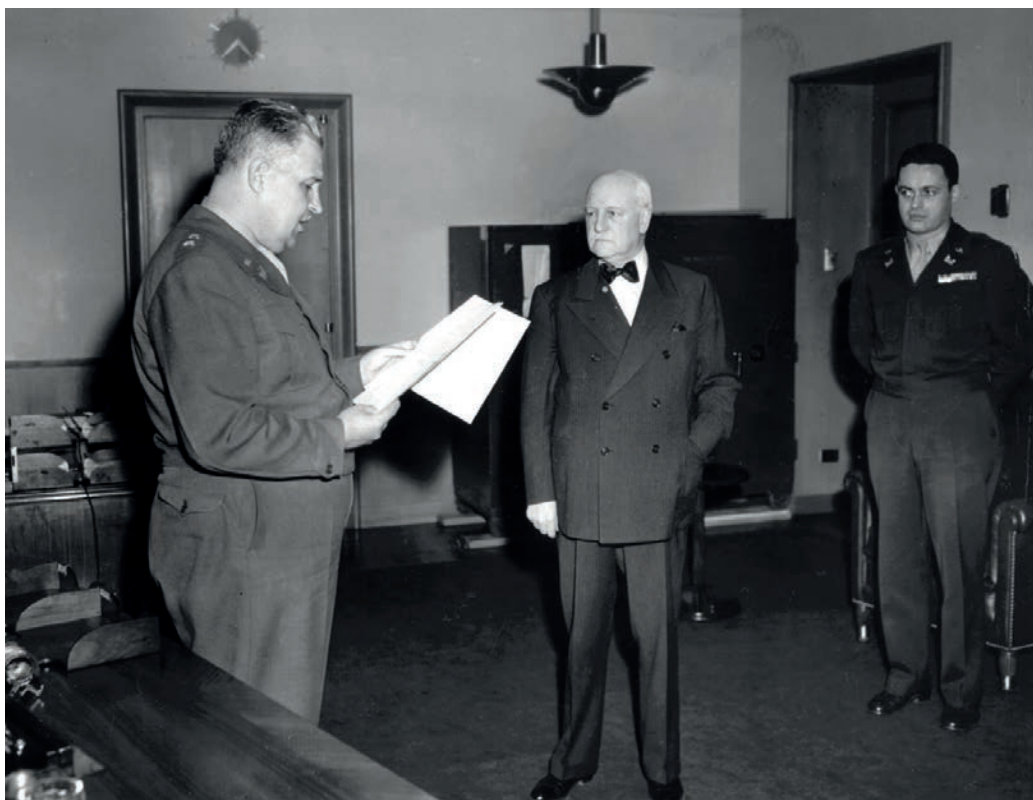
Edgar Sengier (midden) ontvangt een medaille voor zijn rol – de verkoop van uranium uit Congo – in de ontwikkeling van de Amerikaanse atoombom tijdens WO II, het zgn. Manhattanproject. ( https://www.atomicheritage.org/profile/edgar-sengier )

gedaan, onder andere door de parlementaire onderzoekscommissie die in 2000 werd ingesteld om de moord op Patrice Lumumba en de mogelijke betrokkenheid van Belgische politici te onderzoeken (ook bekend als de ‘Lumumba-commissie’). De onderzoekers konden als eersten de archieven van Union Minière, die ook voor dit onderzoek zijn gebruikt, raadplegen. Hierdoor is intussen bekend dat Union Minière de Katangese secesiebeweging financieel steunde. De periode die hieraan voorafging en die deze beslissing heeft beïnvloed, is tot nu toe echter minder onderzocht. Dit artikel richt zich op deze periode en maakt gebruik van de briefwisseling tussen de UMHK-bedrijfsleiders in Brussel en Elisabethstad (het huidige Lubumbashi).