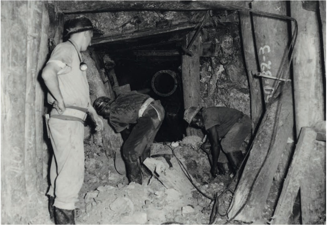
De Mine Prince Leopold.

Na de oorlog bleef Union Minière groeien. Hoewel de jaren 1950 op economisch vlak een gouden periode waren, werd het bedrijf steeds meer geconfronteerd met het Afrikaanse streven naar onafhankelijkheid. Vanaf 1956 begonnen de koloniale autoriteiten en de Belgische ondernemingen in te zien dat ook Belgisch-Congo in deze richting evolueerde. De periode waarin de UMHK-bedrijfsleiders deze evolutie onder controle trachten te houden, is onderwerp van dit artikel. Opvallend is dat zelfs de onafhankelijkheid van Congo de productie van UMHK niet deed afnemen, integendeel. In 1960 produceerde het bedrijf voor het eerst de symbolische omvang van 300.000 ton koper. Ook de secessie van Katanga (1960-1963) en de Congocrisis (1960-1965) hadden weinig invloed op de productie. In 1966 kende UMHK zelfs een absoluut topjaar. 11