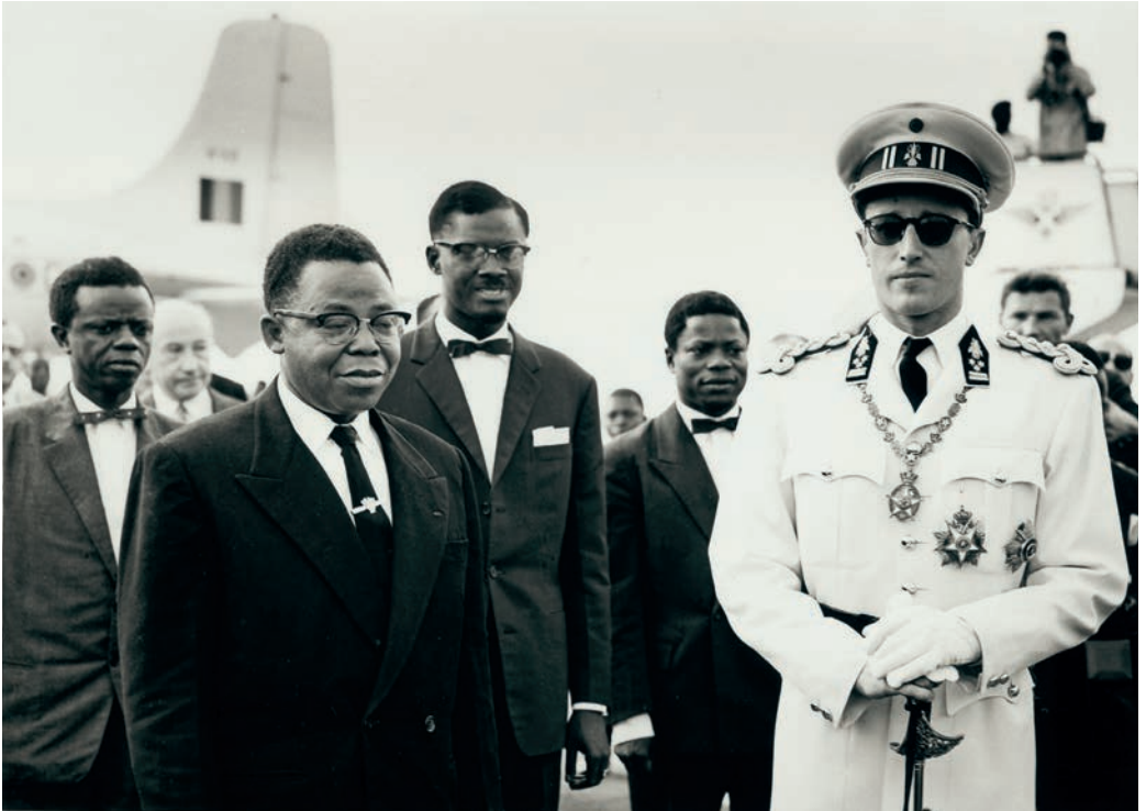
President Joseph Kasavubu en premier Patrice Lumumba ontvangen koning Boudewijn naar aanleiding van de onafhankelijkheidsverklaring van Congo, 1960.

bedrijf was er vooral op gericht om de onafhankelijkheid uit te stellen en de belangen van Union Minière te verzekeren. Uit schrik voor een te dominant Congolees nationalisme streefde UMHK naar de uitbreiding van provinciale autonomie in Congo, met name in de koperprovincie Katanga. Het bedrijf stond wantrouwig tegenover de koloniale en Belgische overheid, die het niet slagvaardig genoeg vond om het hoofd te bieden aan de explosieve situatie in Congo. In haar strijd tegen de hervormingsgezinde krachten hanteerde UMHK verscheidene methoden. Ten eerste steunde het bedrijf Congolese kranten met een visie die aanleunde bij die van Union Minière. De steun bestond voornamelijk uit financiële middelen (schenkingen of leningen), waardoor het bedrijf invloed kon uitoefenen op de inhoud van de artikels. Ten tweede