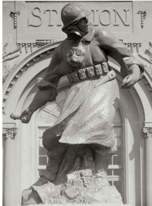
De hoofdingang van het olympisch stadion verwelkomde bezoekers met een standbeeld van een soldaat met een handgranaat in de hand. De sokkel van het beeld vermeldde de datum van de Wapenstilstand.

Ondanks de vaak chaotische organisatie en de gebrekkige publieke belangstelling werd met de Antwerpse Olympiade een dubbel doel bereikt. De Spelen hielpen de wereld om te gaan met recente maatschappelijke trauma's en zorgden daarnaast voor een noodzakelijke en versterkte doorstart van de Olympische Beweging. In plaats van zich zorgen te moeten maken over primaire levensbehoeftes kon men – voornamelijk de gegoede klasse – de blik terug op de toekomst richten en