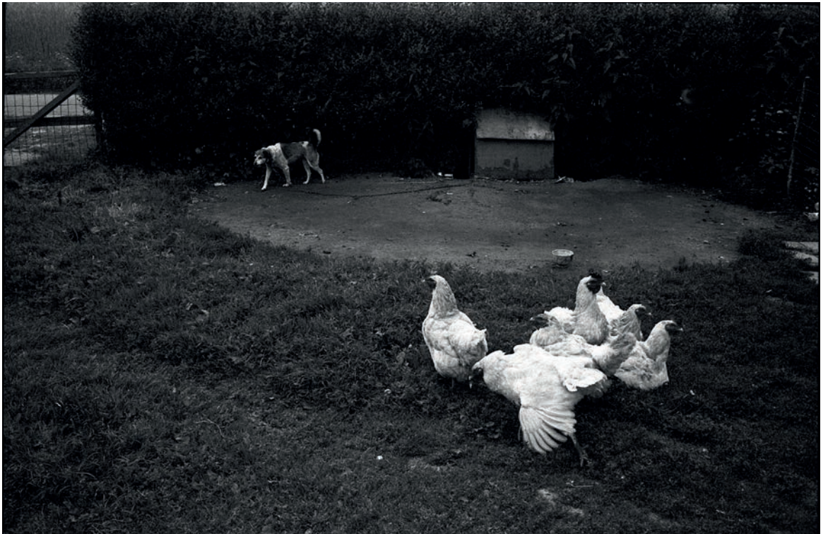
Boven: Huwelijksstoet, Lokeren, 1976. Onder: Oost-Vlaanderen, 1976.