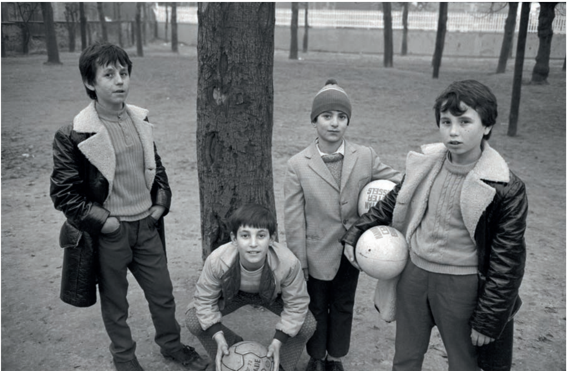
Boven: Kinderen tijdens hun rondgang van huis naar huis met Driekoningen, Ursel, 1966. Onder: Kinderen in een park in Brussel, jaren 1970.