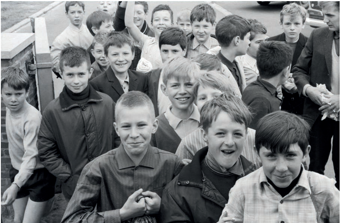
Boven: Repetitie van de Koninklijke Fanfare Sint-Cecilia van Moerkerke, jaren 1965-1970. Onder: Kinderen ergens te lande aan de schoolpoort, jaren 1970.