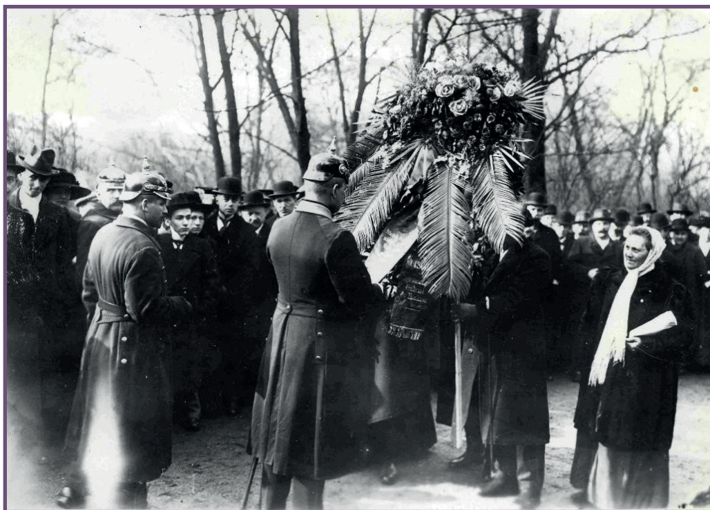
Berlijnse politieke politieagenten lezen de linten op de rouwkransen. Foto: Otto Haeckel, 1918 (© Deutscher Historisches Museum, Berlin)

Een 500-tal mensen begaf zich daarop naar de Landsberger Platz, vlak bij de plaats waar de bereden politie was gestationeerd. De sociaaldemocratische krant Vorwärts beschreef op 19 maart de confrontatie tussen de politie