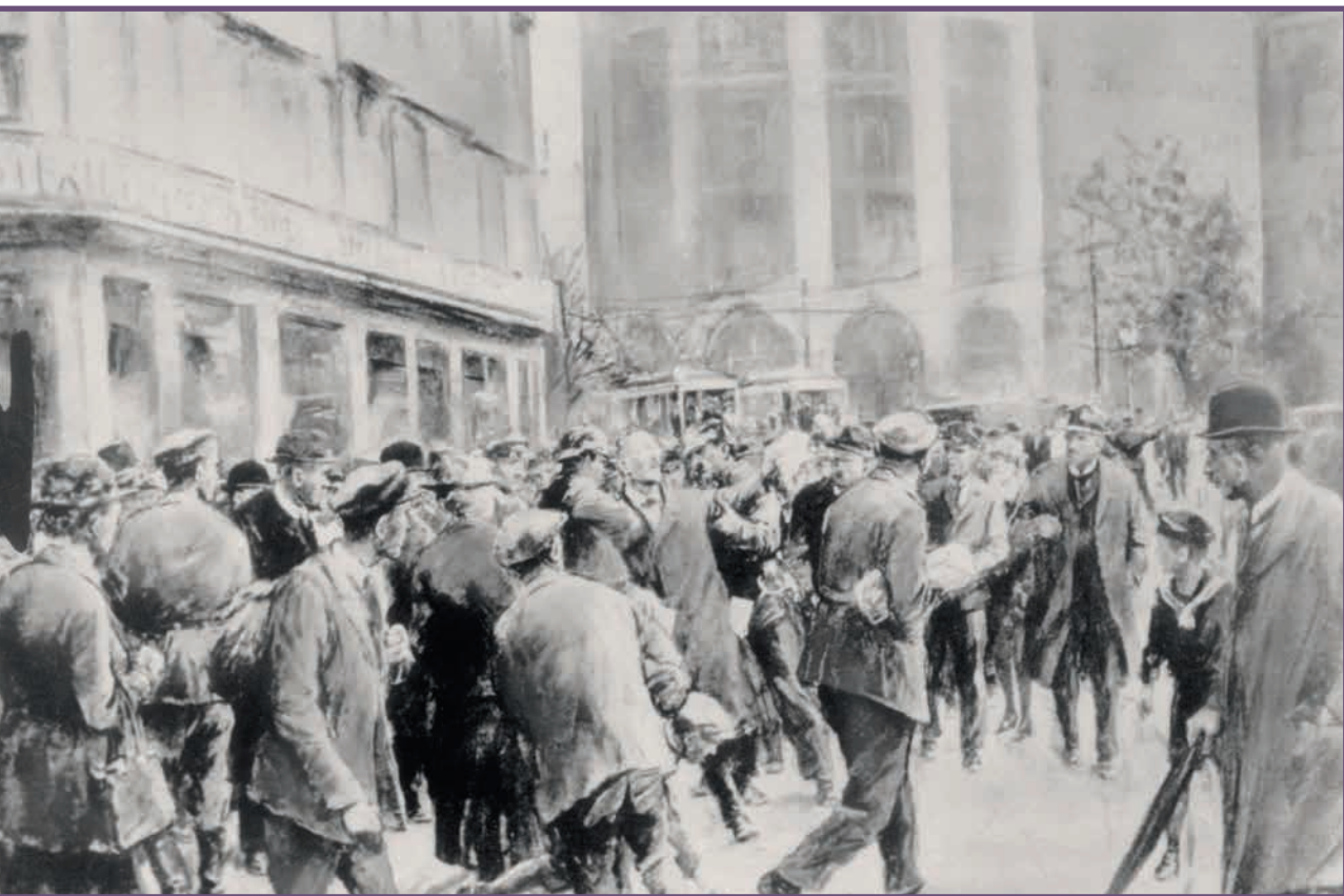
Tekening van de arrestatie van Karl Liebknecht tijdens een anti-oorlogsmanifestatie op de Potsdamer Platz op 1 mei 1916.

Märzgefallenen bezoeken en brachten ze elk jaar opnieuw een krans met een zwart lint.