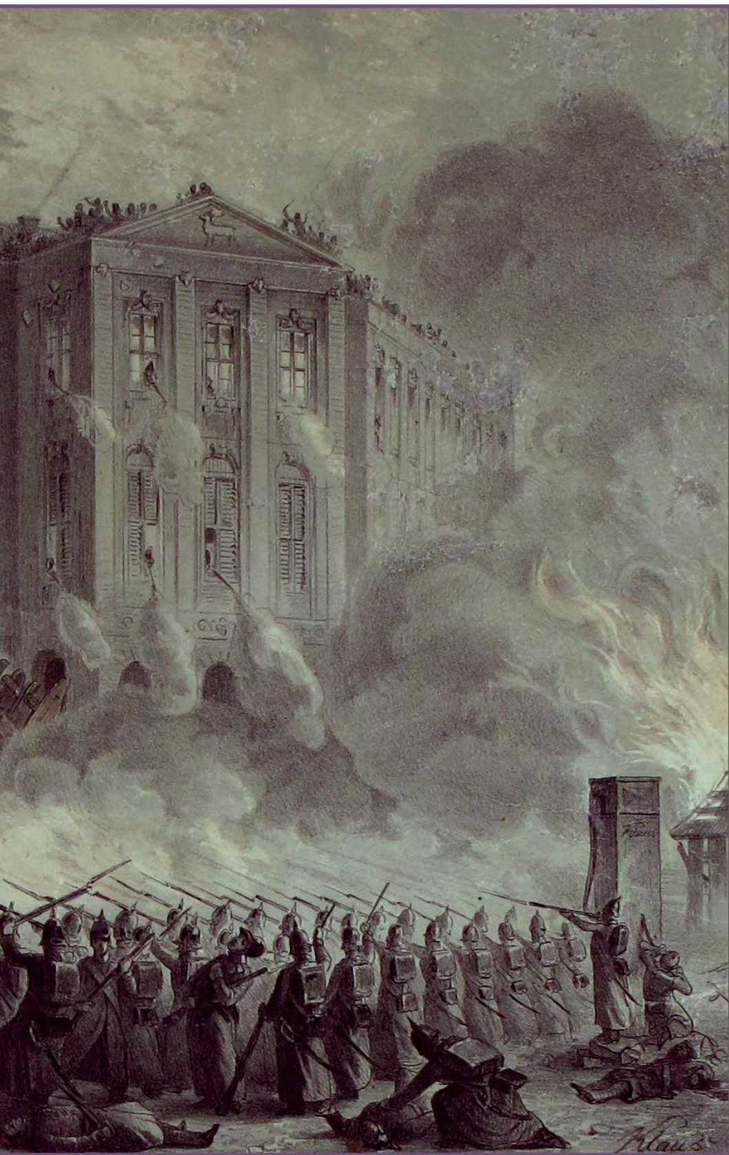
Barricade-gevecht op de Alexanderplatz in Berlijn in de nacht van 18 op 19 maart 1848. Schilderij van Carl Glück.