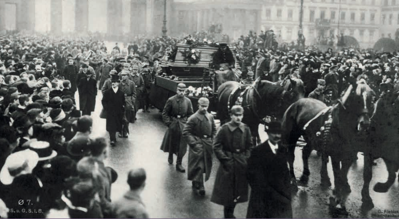
Begravenis van de gesneuvelde van de Maartrevolutie van 1918. Ook zij werden begraven op het Friedhof der Märzgefallenen.

Zeker als we de revolutie die in 1917 uitbrak in Rusland en het feit dat in november 1918 de zogenaamde Novemberrevolutie of Duitse revolutie de hoofdstad bereikte, in het achterhoofd houden. Net daarom is het zo opvallend dat de begraafplaats in 1917 en in 1918 zo weinig bezoekers lokte.