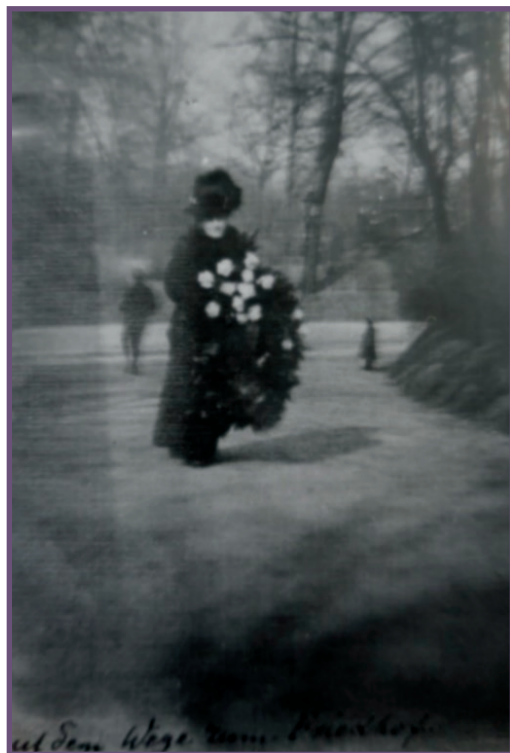
Een vrouw brengt een rouwkrans op het Friedhof der Märzgefallenen. Deze foto is genomen door agenten van de politieke politie in Berlijn.

king en onderwerping dat ontstond door de aanwezigheid van politiecontrole. 25