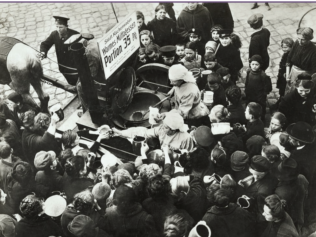
Mobiele keuken in Berlijn in 1916.

dichten uit de 19e eeuw. In het bijzonder het gedicht Trotz alledem was op vele kransen te vinden. Ferdinand Freilingrath schreef het in 1848 en baseerde het op A Man's a Man for A' That , een gedicht van de Schotse schrijver Robert Burns. Trotz alledem werd geschreven naar aanleiding van de revolutie van 1848. Toch was er een nog veel belangrijker reden waarom net dit gedicht zo vaak te lezen was op de linten die de kransen sierden. In de loop van de 19e eeuw had het zich namelijk op de melodie van een populair drinklied,