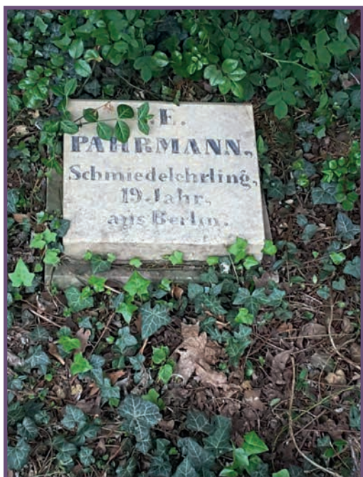
Grafstenen van gesneuvelden tijdens de opstand van 1848 in Berlijn, op het Friedhof der Märzgefallenen in het Volkspark Friedrichshain. (zie ook p. 19)

met redevoeringen, zang en dans in mooi uitgedoste feestzalen. De Märzfeier kunnen zeker beschouwd worden als de voorloper van de 1 mei-optochten die voor het eerst georganiseerd werden in de jaren 1890. Voor dit onderzoek willen we echter vooral de functie van de Märzfeier als volksprotest benadrukken. Het bezoek aan de begraafplaats op 18 maart en het schenken van de rouwkransen, waarvan de linten beschreven waren met teksten over revolutie en strijd, waren immers bovenal publieke vertoningen van protest door 'gewone' mensen tegen het bestaande politieke systeem. Deze rituelen leunden in die zin aan bij de straatedemonstratie: de openbare ruimte werd benut om claims te maken, misnoegen te uiten en verandering te eisen.