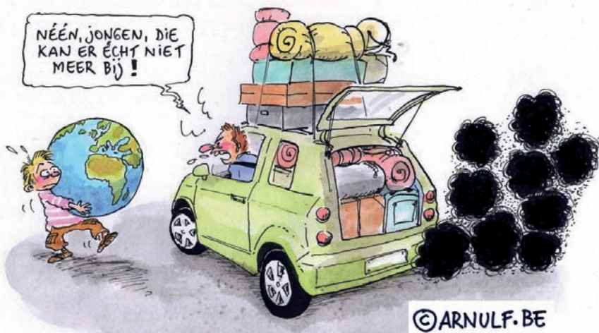
Cartoon ontworpen voor VODO. © Arnulf

maatverandering tegen te gaan. Een belangrijke doelstelling van het verdrag was 'het stabiliseren van de concentratie van broeikasgassen in de atmosfeer op een zodanig niveau, dat een gevaarlijke menselijke invloed op het klimaat wordt voorkomen'. 14 Vanaf 1995 werden er in het kader van het verdrag ook jaarlijkse conferenties georganiseerd: de United Nations Climate Change Conferences of klimaatconferenties. 15 In hetzelfde jaar verscheen ook het tweede rapport van het IPCC.