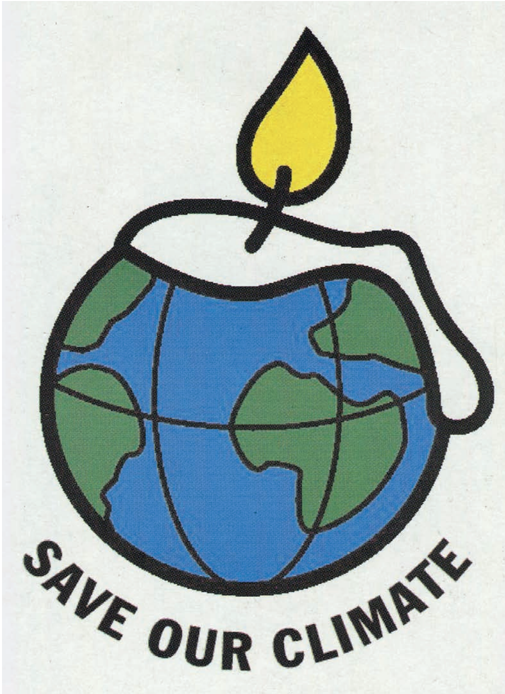
Prentbriefkaart met een afbeelding van de aarde als een brandende kaars. (Amsab-ISG, Gent)