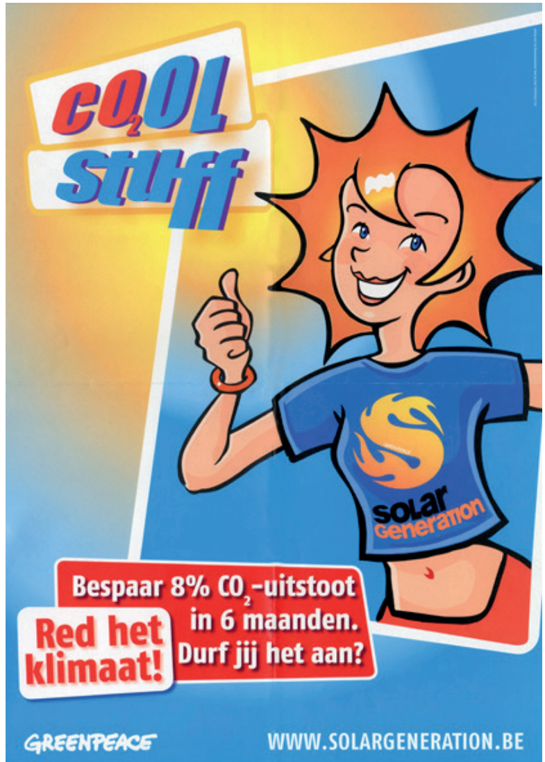
Affiche van Greenpeace België voor milieubescherming, 2005.