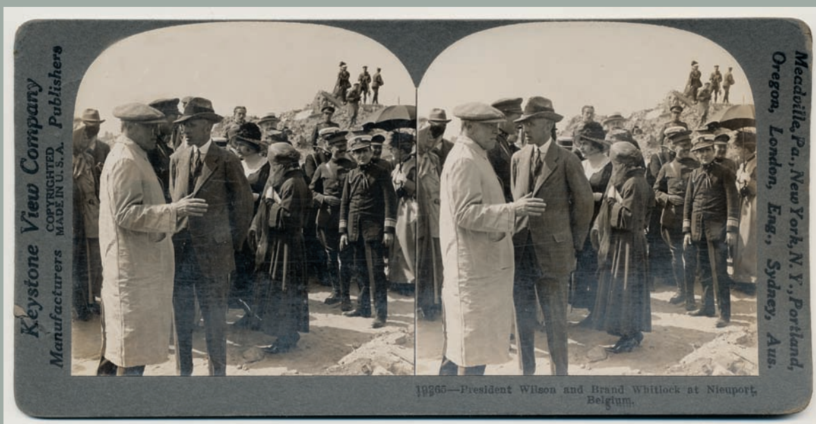
De Amerikaanse president Woodrow Wilson kwam kort na de oorlog op bezoek in de geteisterde stad Nieuwpoort. Op de foto is Wilson (links) in gesprek met Brand Whitlock die tijdens de oorlog als gevolmachtigd minister verantwoordelijk was voor de Amerikaanse hulp aan België.

industrie: met wat nu als ‘loopgravenkunst’ bekendstaat, zoals de versierde koperen obussen. Die werden wellicht grotendeels na de oorlog gemaakt. Gelet op de koper-schaarste en de uiterst penibele situatie aan het front lijkt het weinig waarschijnlijk dat tijdens de oorlog zo’n grote productie van bewerkte obussen tot stand kon komen.