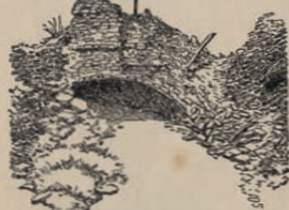
Bouwvalen die tot bespiedingspost en tot schiedrijksdenkm.

1. Nieuwpoort (Bad). Liniervestende van het westelijk front. Dit gedeelte van het front werd in October 1914 verdedigd door de 2 e L. A. van de zee tot Sint-Joris. Ging vervolgens over aan de Fransen, dan aan de Engelsen en werd einde 1917 voor goed overgenomen door de Belgische legernacht. Tot in 1917 bestond het front ten Oosten van de vaarsen. Hierover waren verschillende bruggen ge-