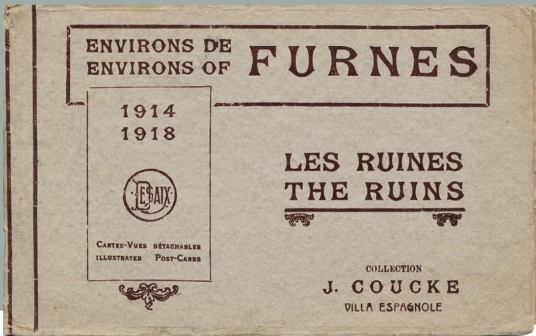
Prentbriefkaartuitgevers zagen brood in de nieuwe markt en gaven massaal boekjes met afscheurbare kaarten voor de fronttoeristen uit.

werkte. In 1916 kreeg hij een gids van het Belgische leger ter beschikking en trok hij van Le Havre over Reninge naar De Panne. 1 In zijn geïllustreerde brochure beschreef hij koning Albert I als 'le roi chevalier' en koningin Elisabeth als iemand die het als haar plicht zag om te 'soulager les malheureux, reconforter ceux qui souffrent' . De mythes van de koningin-verpleegster en de 'ridder te paard' die vecht tegen het onrecht kaderden in het beeld van het 'brave little Belgium' , het kleine land dat zich verzette tegen het grote en onrechtvaardige Duitse leger. De koning was ook opperbevelhebber en ook dat werd dankbaar uitgespeeld in de pers. In die hoedanigheid ontving hij in het niet-bezette deel van het land immers heel wat prominenten, zoals de Franse president Poincaré en bevelhebber Pétain.