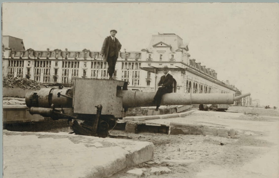
Poseren op het Duits geschut bij het Royal Palace Hôtel in Oostende. De foto werd als prentbriefkaart naar het thuisfront gestuurd.