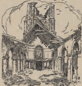
Bouwvalen van de Kerk van het dorp, Woesten.

6. Sint-Joris. Op 19 October had daar een heldhaftige overstand plaats van het 2 e Inf. Dit dorp, ingenomen en terugveroverd, bleef ten slotte in handen van de Boesigenooten ten gevolge van een schietend