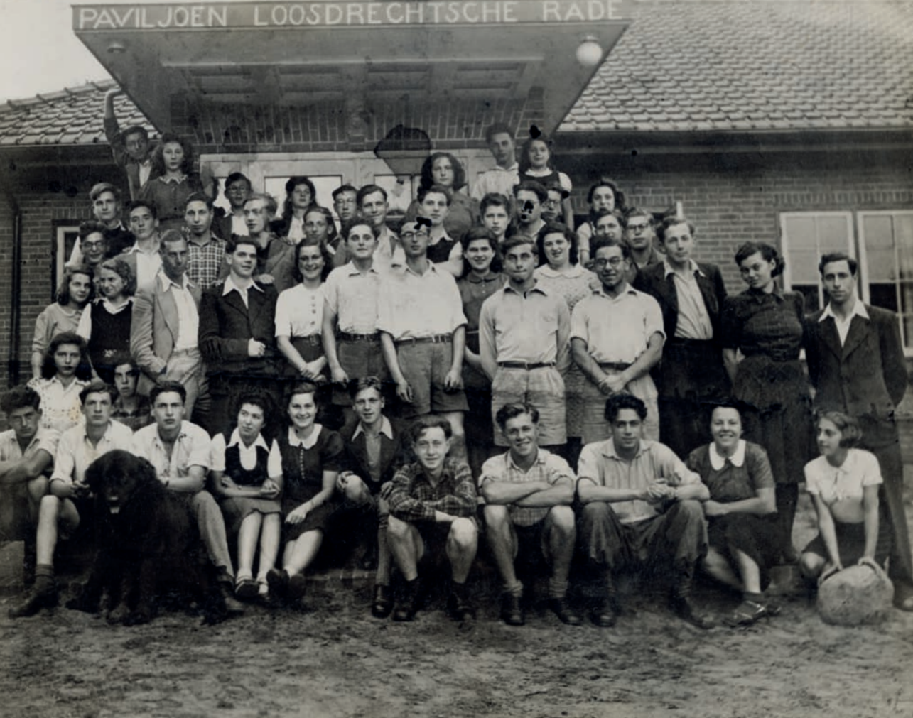
De pioniers van Loosdrecht, die in augustus 1942 met de hulp van de Westerweelgroep onderdoken.