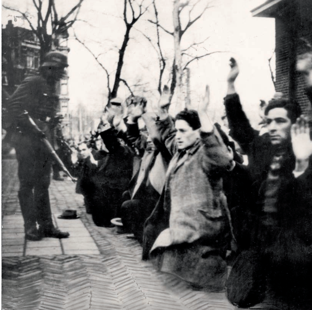
Geknielde Joden worden onder schot gehouden in Amsterdam na de staking tegen de Jodenvervolging in februari 1941. De foto werd na de Tweede Wereldoorlog hét icoon van de Jodenvervolging in Nederland en van de Februaristaking.

genootschap, de Vergadering der Gelovigen. Deze vernieuwingsbeweging was in Engeland ontstaan, inspireerde zich op de eerste christelijke gemeenten en koppelde dit aan eerbied voor het Oude Testament. Alhoewel Joop Westerweel al jong brak met de Vergadering bleef de Bijbel een inspiratiebron voor hem. In politiek opzicht was hij actief aan de linkerkant van de sociaaldemocratische SDAP. Toen hij begin jaren 1920 in Nederlands-Indië als onderwijzer ging werken, bracht dit hem in moeilijkheden. De overheid wilde hem er eerst niet toelaten en liet hem daarna door de geheime dienst volgen. Toen die 'illegale