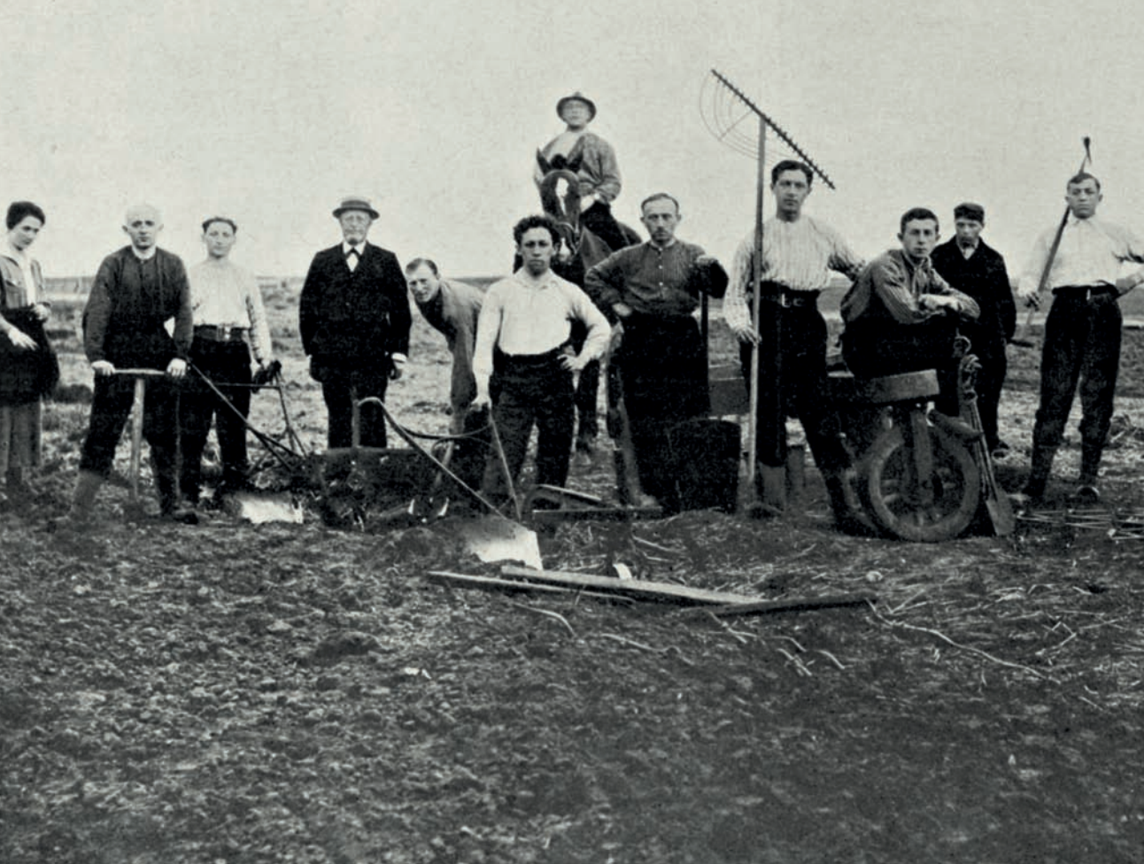
Palestinapioniers aan het werk in Marum (Friesland) (links) en in Deventer (rechts), begin jaren 1920.