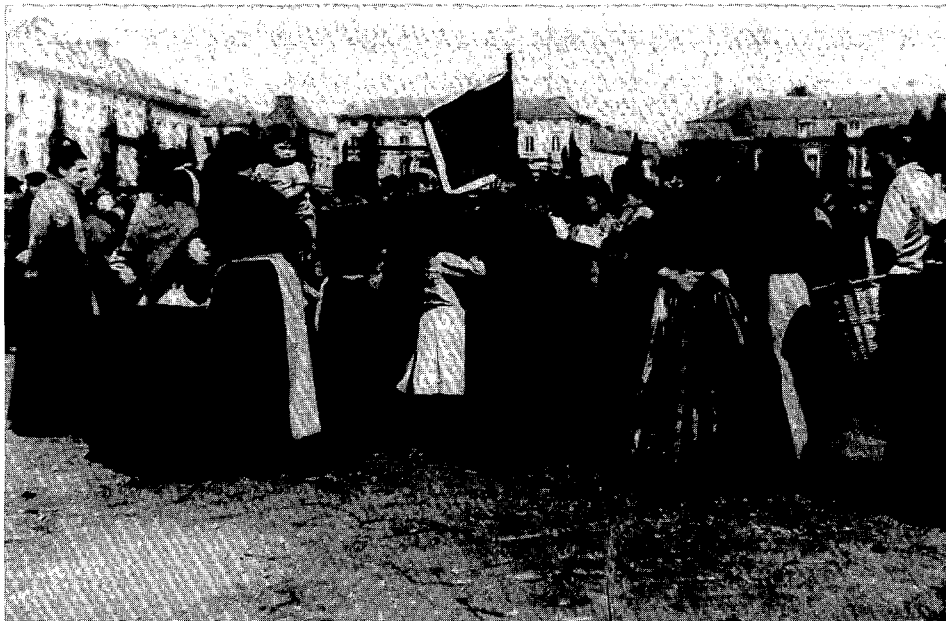
Vrouwen betogen voor Algemeen Stemrecht, Gent, 1893

schappen ontbraken bij de vrouwen echter zo goed als volledig. Ze waren de industrie bijgevolg van weinig of geen nut. De stijgende nood aan arbeidskrachten betekende bovendien dat er meer kinderen geboren moesten worden. De taak van de vrouwen, namelijk het krijgen van kinderen, verzwaarde hierdoor.