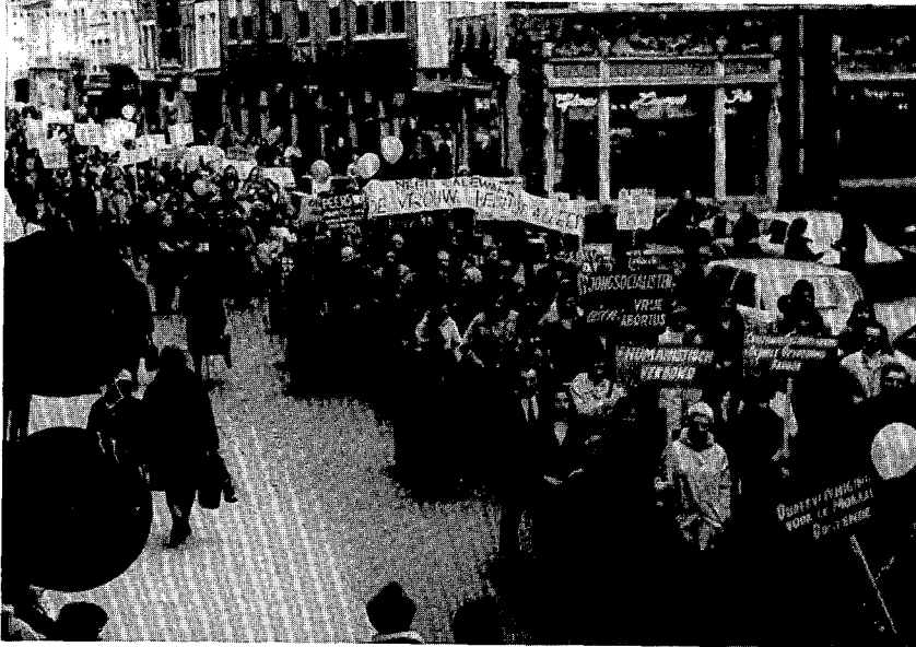
Betoging pro abortus, Brugge, februari 1973. Foto verschenen in het Vlaams Weekblad

werkten een aantal vrouwen, en ook enkele mannen, afzonderlijk aan allerlei onderwerpen betreffende de vrouw. Maar van hun kant wilden de academici niet meemarcheren in een onderzoek dat aan vooropgestelde feministische doelstellingen zou moeten beantwoorden.