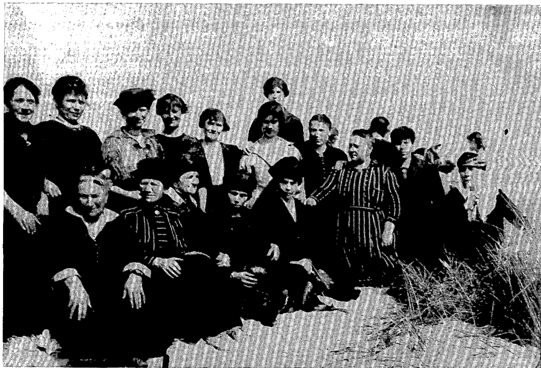
Socialistische vrouwen van Oostende op stap in de duinen