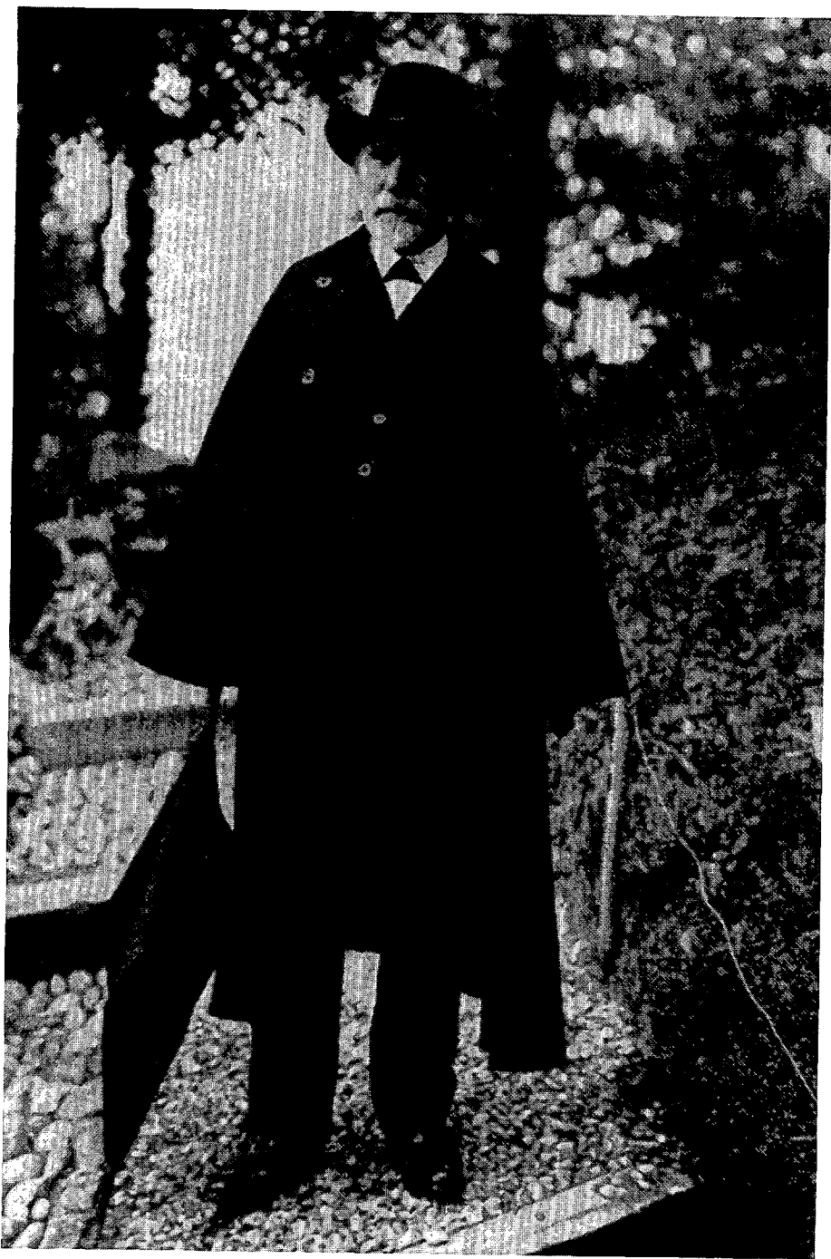
Een voorbeeldige huisvader volgens de enen, schrijver van "vuile boeken" volgens de anderen: August Bebel (1840-1913), Duits socialistenleider en auteur van het geruchtmakend werk "De Vrouw en het socialisme"