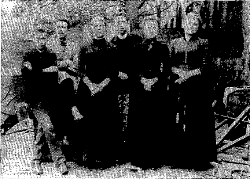
Personeel van Vooruit, 1890

leden te tellen. De crisis van de vrouwenvereniging na 1895-1896 is overigens niet uitzonderlijk, ook de Jonge Wachten hadden met dergelijk probleem te maken. En dat ondanks het feit dat het potentieel aan jonge en vrouwelijke leden, nieuwe gesyndiceerden bijvoorbeeld, wel toenam in die jaren; de textielvakbonden bijvoorbeeld kenden een stijgende feminisatiegraad. Van Praag argumenteert voorts - op suggestieve wijze - hoe het vertrek van Emilie een factor van discontinuïteit betekende in de mentaliteit van de socialistische vrouwenbeweging na Emilie Claeys. In het nieuwe reglement dat op 1 juli 1900 werd goedgekeurd, konden - zoals voordien - "alleen vrouwen van onberispelijk gedrag lid worden" (een regel die overigens reeds lang overgenomen was van de Socialistische Propagandaclub, een overwegend mannelijk gezelschap). "Maar", schrijft van Praag, "de bijzondere bepaling ten aanzien van gehuwde moeders had men laten vallen". Die subtiele suggestie doet het voorkomen alsof, 1. dit een "reactie" was op de "affaire Claeys" (wat moeilijk met andere bronnen te staven is); 2. ongehuwde moeders voortaan werden geweerd. Het lijkt mij niet oninteressant verder te onderzoeken of er inderdaad in de socialistische bewe-