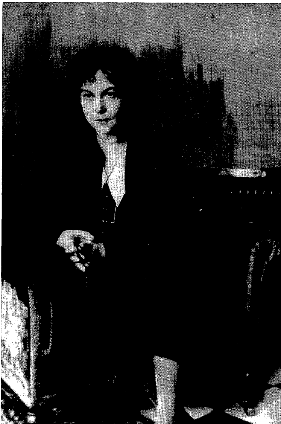
Bekend als verdedigster van de seksuele vrijheid van de vrouw: Alexandra Kollontai