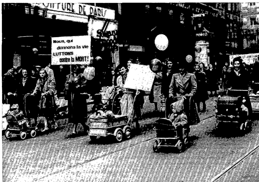
"Voor het heil van onze kinderen": een vredesbetoging van vrouwen, Brussel, jaren vijftig

ten. In december 1964 richtte men ook binnen het ABVV-nationaal een werkgroep op die uitgroeide tot een soort vrouwencommissie zonder duidelijke structuur. De nieuwe impuls die de staking bij FN-Herstal in 1966 aan het vrouwen-syndicalisme gaf (en die resulteerde in de oprichting van het actiecomité "Gelijk loon voor gelijk werk"), leidde dan uiteindelijk tot de oprichting van een Nationale Vrouwencommissie. Zij bestond uit 2/3 vertegenwoordigers van de vrouwencommissies opgericht in de centrales en 1/3 vertegenwoordigers van de vrouwencommissies uit de gewestelijke afdelingen. In 1976 werd beslist een Bureau van de Vrouwencommissie op te richten die de schakel moest vormen tussen de nationaal verantwoordelijken van de vakbond en de commissie. De vrouwenwerking van de vakbond slaagde erin belangrijke resultaten te boeken inzake gelijk loon voor gelijk werk, toegang tot de arbeidsmarkt, beroepsopleiding, arbeidsomstandigheden, familiaal verlof enz... De nationale vrouwencommissie van het ABVV werd in 1990 opgeheven omdat de vrouwen nu voldoende zouden vertegenwoordigd zijn in de vakbondsstructuren.