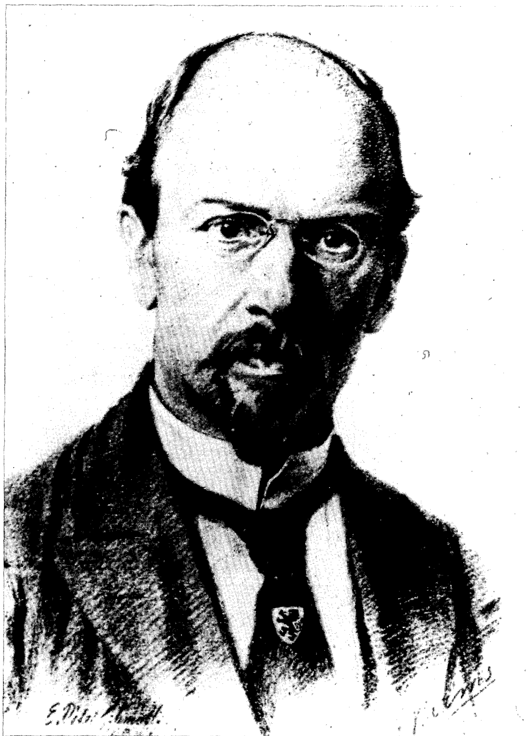
August Borms (1878 - 1946), gevolmachtigde in de Raad van Vlaanderen : "De Duitsers moeten zegevieren..."