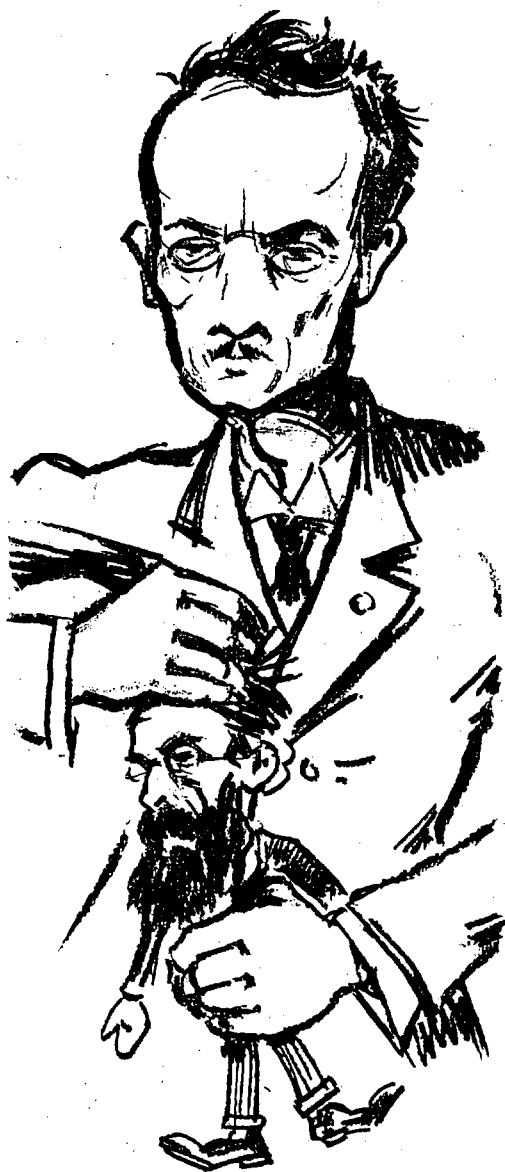
Hoe Camille Huysmans Herman Vos "strikt", karikatuur uit het Vlaamsgezinde weekblad De Noorderklok

oordeling in van zijn vier jaar leiderschap, maar is ook financieel een drama: de vergoeding als volksvertegenwoordiger valt weg. Daarmee kon hij, samen met zijn wedde als hoofdredacteur van De Schelde , zijn gezin onderhouden; nu moet snel een oplossing worden gevonden. Vrijwel meteen twijfelt hij aan zijn toekomst binnen het Vlaams-nationalisme. Zo verklaart hij op een meeting begin december 1932: