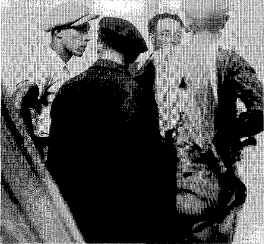
Mijnwerkers in de Borinage