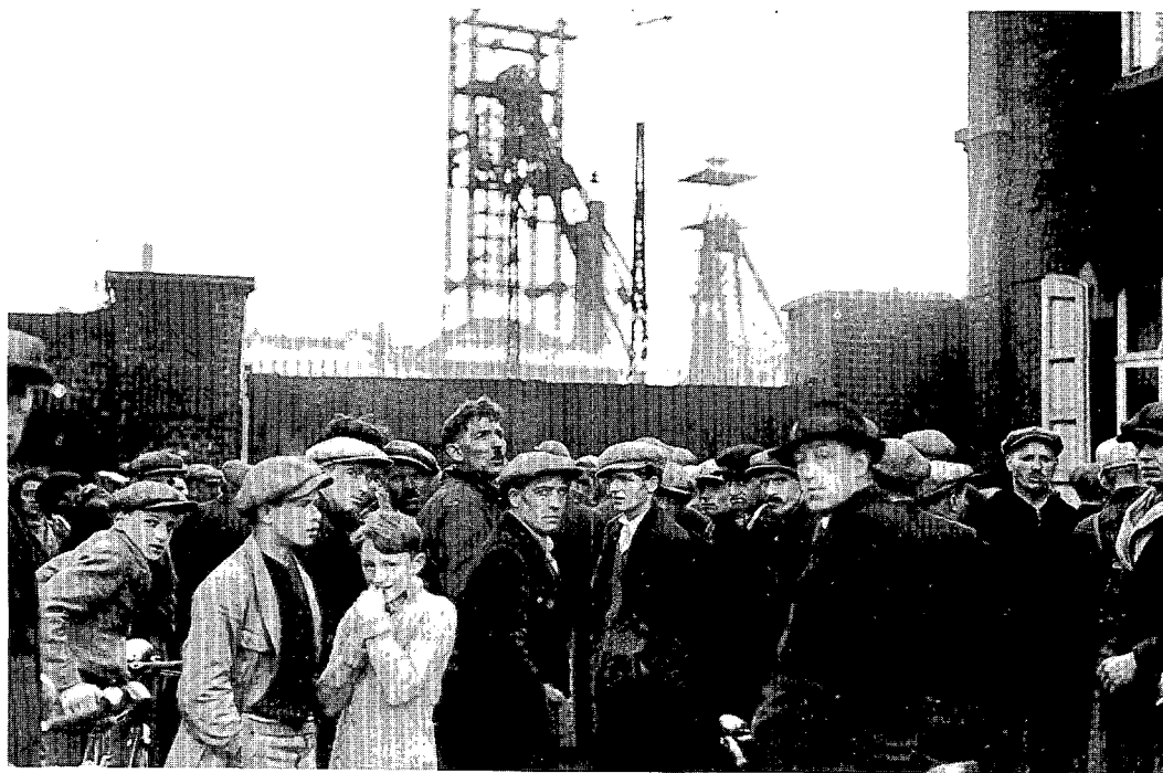
Tijdens de staking van 1932 in de Borinage eisten de lokale mijnwerkers het vertrek van de Poolse arbeiders

kens (27) . De buitenlandse mijnwerkersgemeenschappen in Limburg waren ook wat meer geconcentreerd en wat homogener, maar cruciaal was dat de socialistische vakbondcultuur van het Limburgse bekken nog niet gestabiliseerd was. Zo organiseerde de Poolse migrantengemeenschap bij de in 1920 opgestarte steenkoolmijn de Hainaut (Borinage), die qua afkomst en samenstelling sterk analoog was aan de Poolse mijnwerkersgemeenschappen in Winterslag en Eisden, zich niet onder de banier van de Mijnwerkerscentrale. Het Boreinse socialisme bood deze Poolse arbeidsmigranten geen enkele opening. In het Limburgse mijnbekken was er nog geen etnische groep die het socialistische vakbondswerk monopoliseerde en zo konden de immigranten, met respect voor hun eigenheid, deze vakbond helpen opbouwen. Het unieke succes van de Limburgse Mijnwerkerscentrale onder de immigranten was evenwel van korte duur. In 1929 werden, als gevolg van wijzigingen zowel in de krachtsverhoudingen in België - een ruk naar rechts - als in de mi-