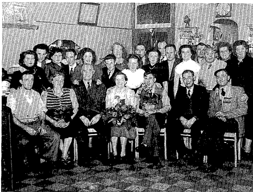
Mijnwerkers uit Roeselare

Vlaamse parochianen blootstonden in volgende termen: