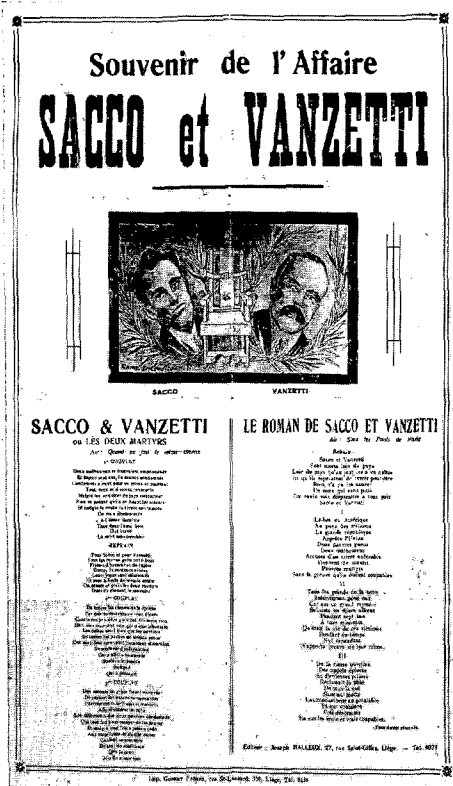
Eén van de liedteksten, te bezichtigen op de tentoonstelling in het AMSAB

voor het cultuurbevorderende lied (3) . Na de Eerste Wereldoorlog raakte het lied in de socialistische propaganda meer en meer op de achtergrond. Binnen de beweging van de Rode Valken kende het nog wel een opbloei, maar na de Tweede Wereldoorlog zette de neergaande trend onverminderd door. De opkomst van de televisie- en radiocultuur hangt daar ongetwijfeld mee samen. Het strijdlid zal nog een nieuwe impuls krijgen vanuit de protestbeweging van de jaren '60, maar ook deze opbloei bleek van tijdelijke aard.