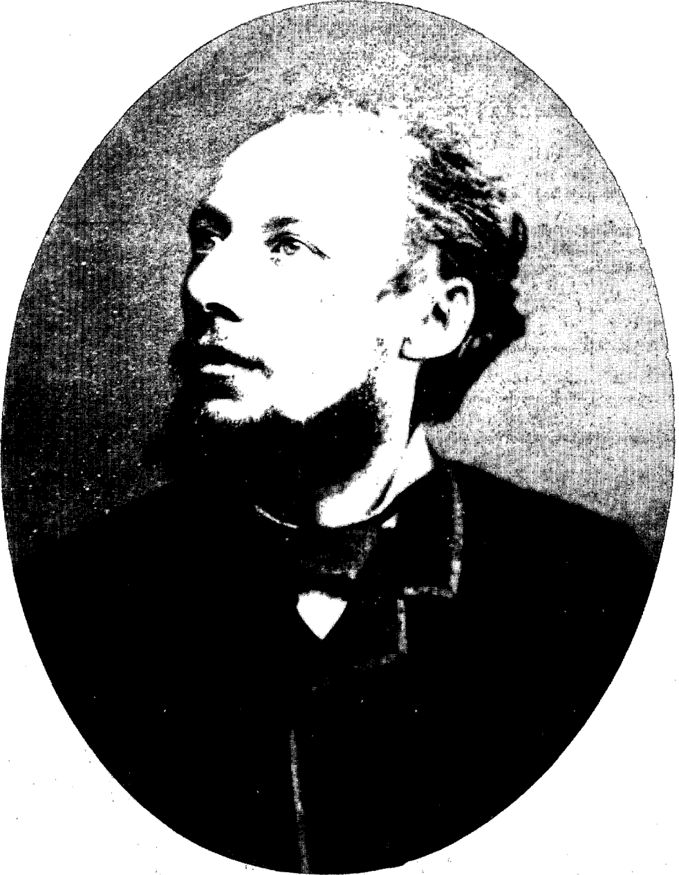
De 'beilige' Van Beveren