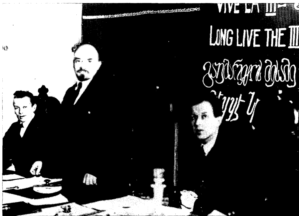
Lenin op het stichtingscongres van de Derde Internationale in maart 1919