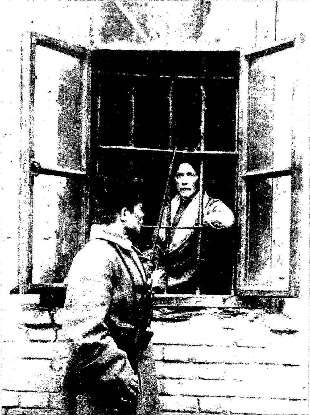
Unieke foto van Maria Spiridonova in een Siberische gevangenis