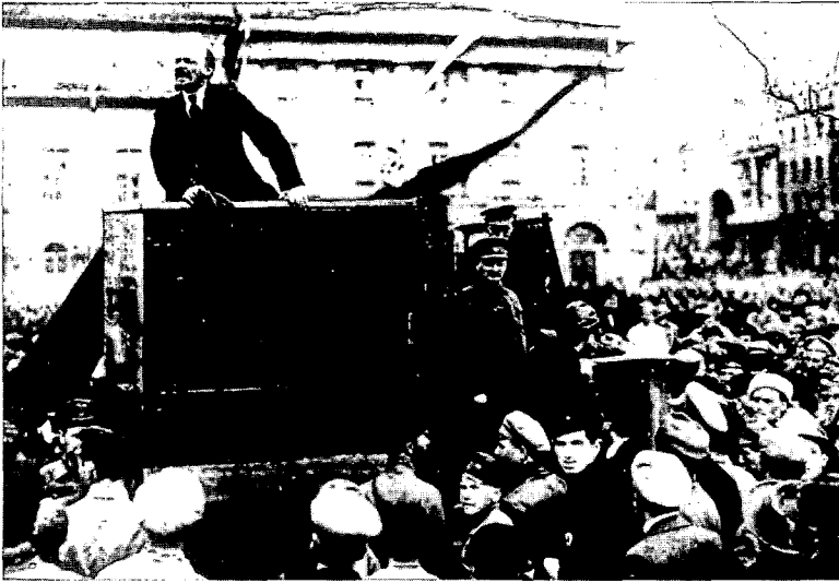
Maart 1917: Lenin spreekt de massa toe. Rechts onder: Trotski en Kamenev

werd door de weduwe Plekhanov. Marcel Cachin zou in een redevoering in de Franse Kamer gezegd hebben dat "de mensjeviken, aanhangers van Plekhanov, die altijd voor de politiek der Ententelanden waren geweest, zich thans naast de bolsjeviken krachtig verzetten tegen deze politiek van aanval en veroveringen" . De weduwe wil blijkbaar voorkomen dat deze woorden verkeerd worden uitgelegd. Zij bevestigt dat de volgelingen en vrienden van Plekhanov, de ideeën van hun meester getrouw, "voortgaan om, gevang en dood trotserend, de krachtdadigste strijd te voeren tegen het bolsjevisme, dat volgens hun zienswijze hoegenaamd niet kan beschouwd worden als socialisme - maar wel als een noodlottige mengeling van anarchisme en syndicalisme met enige slecht begrepen en verkeerd uitgelegde revolutionaire en marxistische gedachten" (76) . Opnieuw wordt bevestigd dat "de constituanten steunde op de belangen van de arbeiders en boerenbevolking. De uiteendrijving door de bolsjeviki is het logisch gevolg van hun aanslag van oktober en een stap naar de plaag van de burgeroorlog in de schoot zelf der arbeidersmassa in Rusland" (77) .