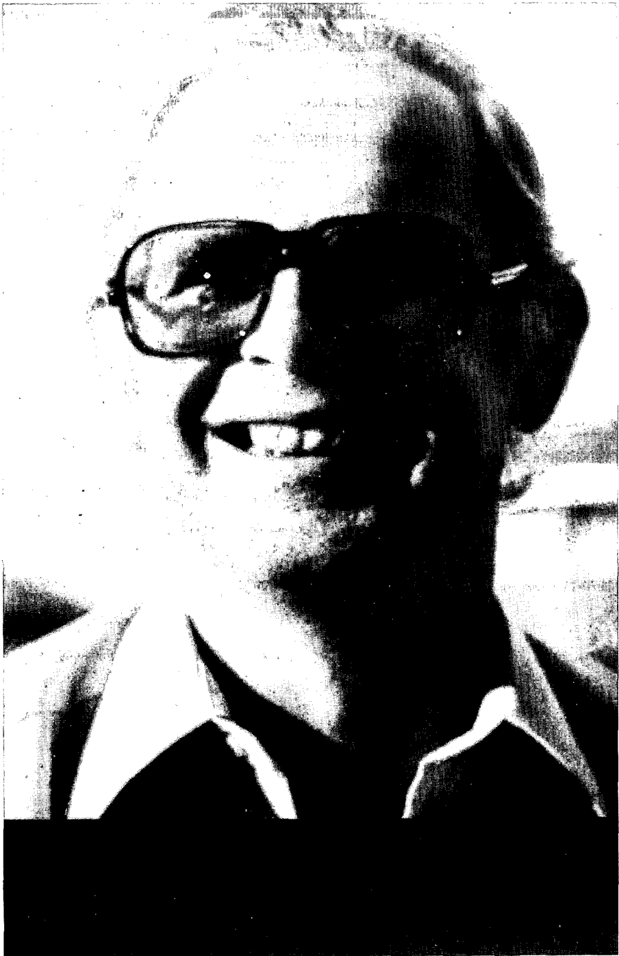
Verkiezingsaffiche van 1981