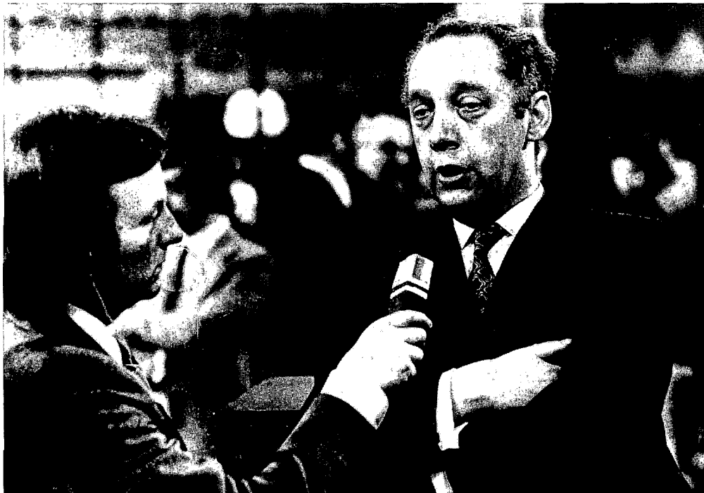
Louis Van Geyt na de parlamentsverkiezingen van 1974