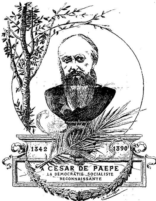
Dernier portrait de CÉSAR DE PAEPE

De retour à Bruxelles, il eut la douleur de perdre sa femme, Henriette Brismée, au moment où des jours plus heureux se préparaient pour le jeune ménage. César De Paepe restait seul avec deux enfants. Malgré tous ces obstacles, il fut