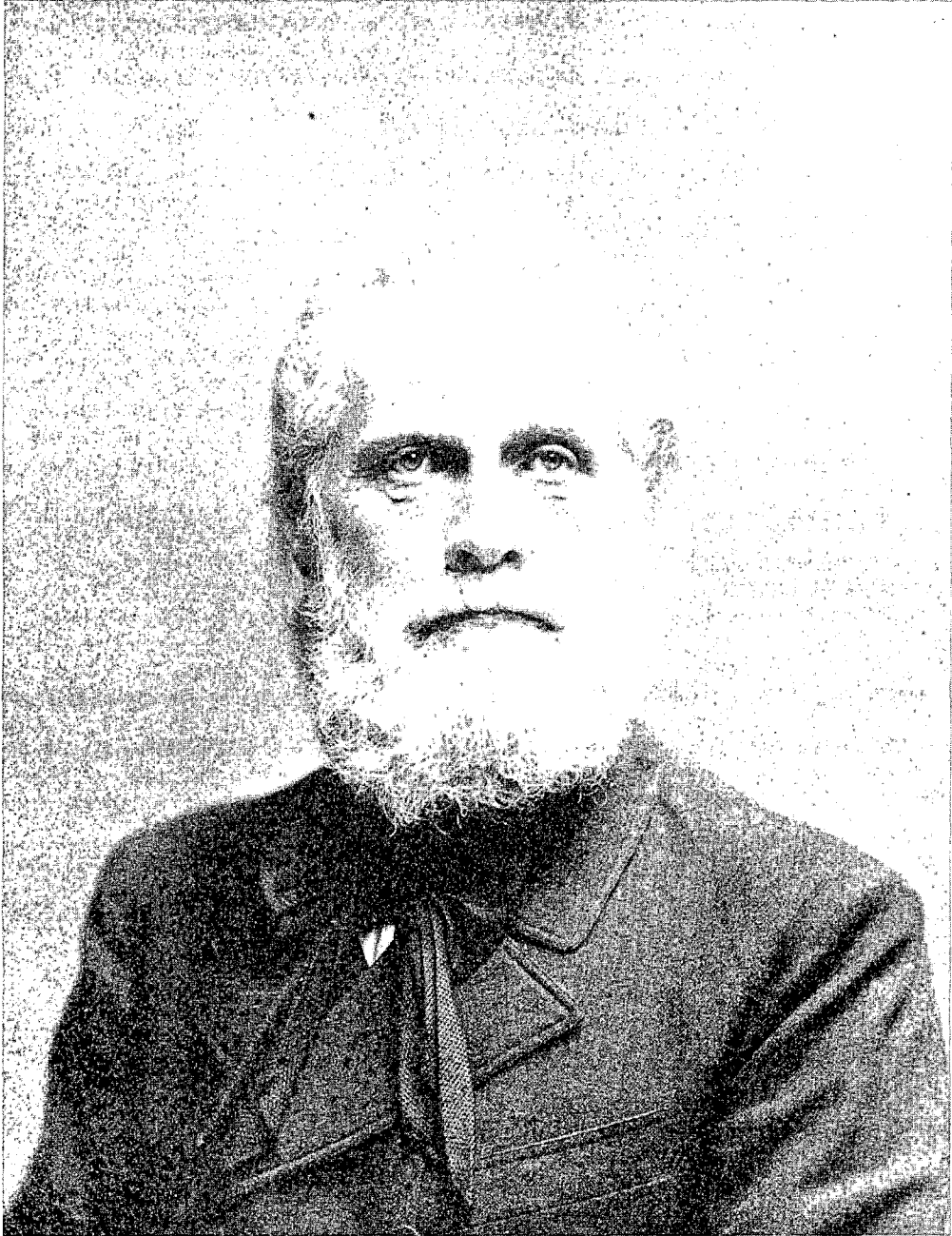
Domela Nieuwenhuis, Nederlandse vrijdenker en socialist, met wie César De Paepe nauwe contacten onderhield