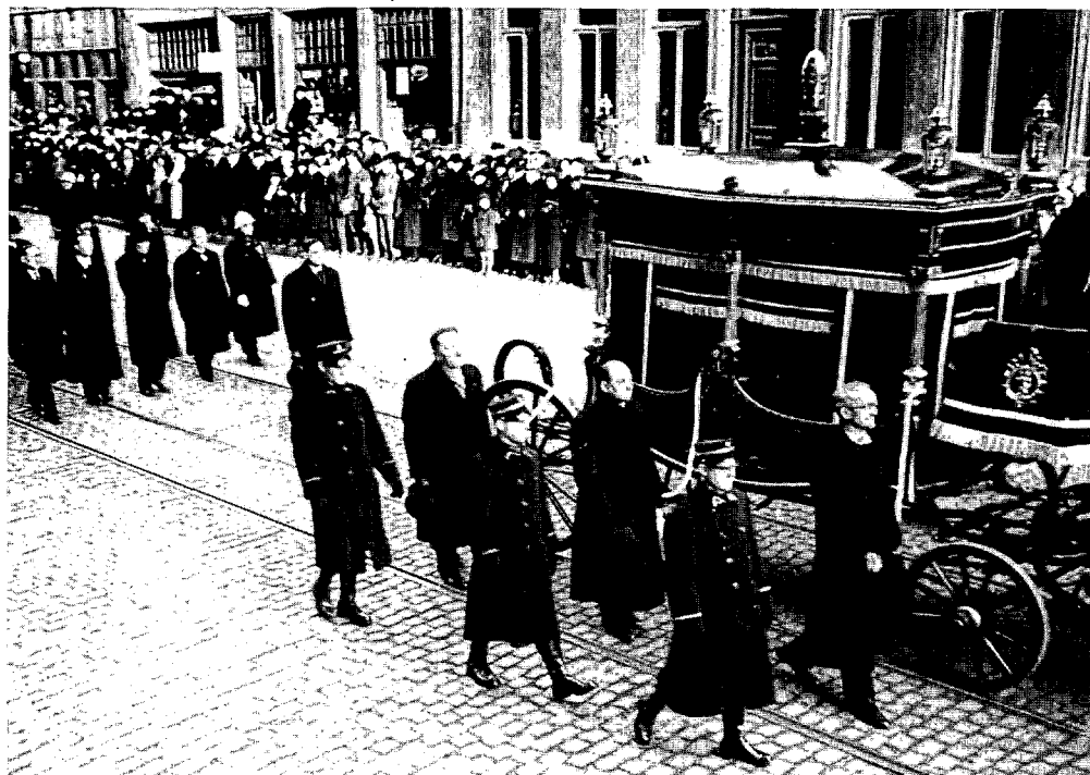
Les funérailles d'Edouard Ansele en 1938 étaient un pas de plus vers les pompes officielles