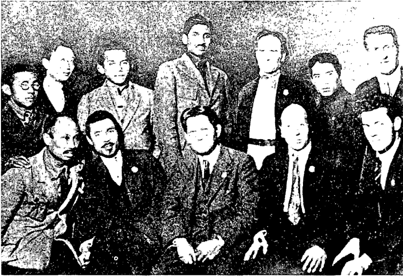
M.N. Roy (midden 2e rij) met Oosterse delegaties op het vierde congres van de Com- munistische Internationale in 1922

staat. Ondertussen bleven de royisten onver- biddelijk kritiek spuien op het hindoeïsme als een slavernij-ideologie, die zij totaal ongeschikt achtten om bij te dragen tot de waarachtige bevrijding van het Indische volk. Daarom pleitte Roy dan ook onomwonden voor een min of meer anti-religieuze culturele revolutie tege- lijk met de politiek-economische die het gemid- delde revolutionaire vertoog vooropstelde. Wat toen reeds sterk naar voor begon te komen in Roy's geschriften, was zijn scherp pleidooi te- gen de fascistische staten en vooral tegen elke vorm van compromispolitiek ermee.