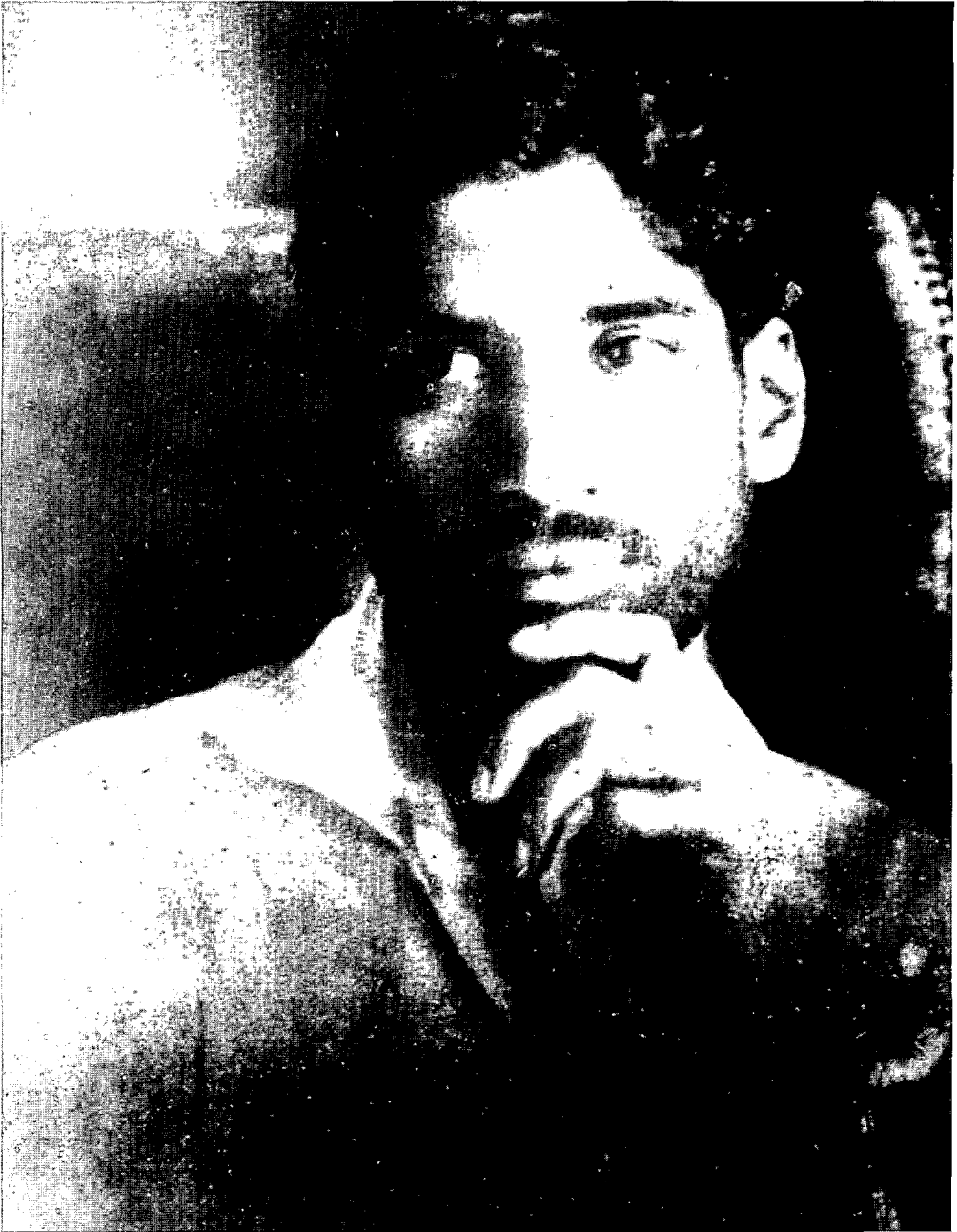
M.N. Roy, één van de merkwaardigste figuren van de Indische contemporaine geschiedenis (Oxford University Press)