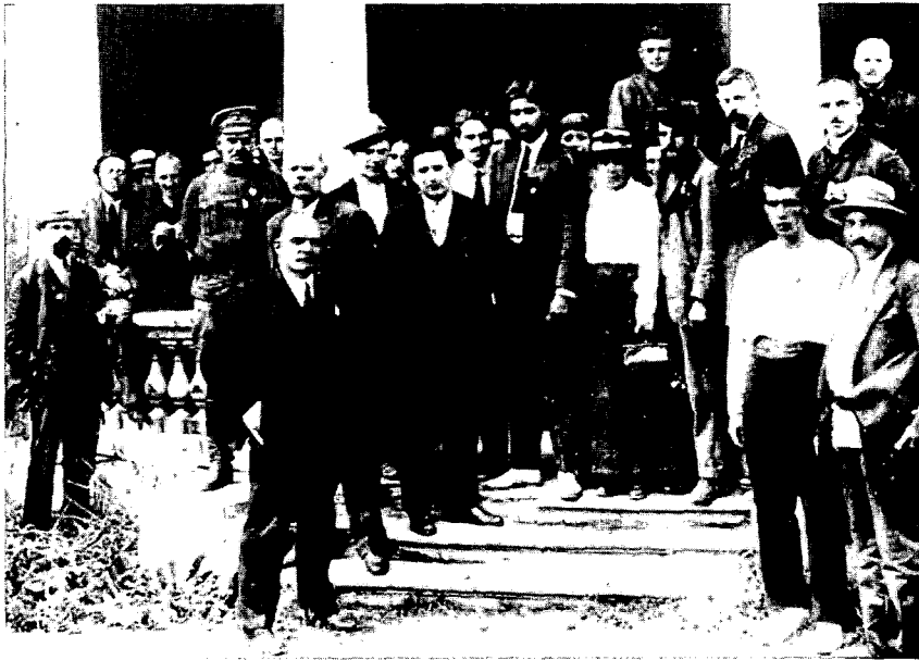
M.N. Roy, (midden op de trap) op het tweede congres van de Commu- nistische In- ternationale in 1920

toonde om een resolutie te laten stemmen die tot op zekere hoogte tegemoet kwam aan de afwijkende analyse van de jonge, briljante Indiër: indien er niet werd uitgegaan van een sleutelrol van een Aziatische revolutie, dan werd de houding tegenover de nationale bevrijdingsbewegingen wel degelijk ingevuld op een manier die vrij dicht aanleunde bij de these van Roy (17) . Het was alleszins duidelijk dat hij zich meteen naar het voorplan had weten te schuiven als één van de belangrijkste Komintern-theoretici van de Aziatische problematiek. In de daaropvolgende jaren schreef hij zijn visie neer in talloze artikels en ook in enkele kleinere monografieën - waaronder het opmerkelijke India in Transition - die zo ongeveer de eerste belangrijke marxistische werken waren over deze thematiek (18) .