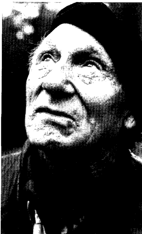
Op zijn tachtigste verjaardag, kort voor zijn dood (Ernst Busch, Eine Biographie in Texten, Bildern und Documenten)

1945 of 1946. Camille Huysmans heeft de Minister van Financiën persoonlijk verzocht om deze schuld voor mij kwijt te schelden, gezien de artistieke, culturele, de historische en de psychologische