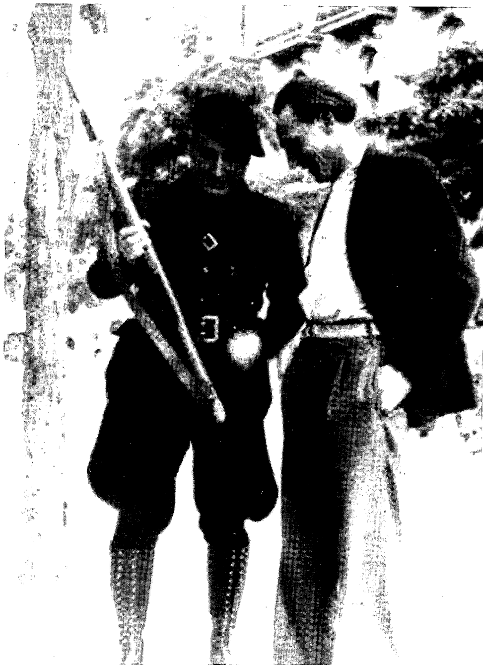
Ernst Busch in Spanje tijdens de Burgeroorlog, 1937 ( Ernst Busch, Eine Biographie in Texten, Bildern und Documenten )