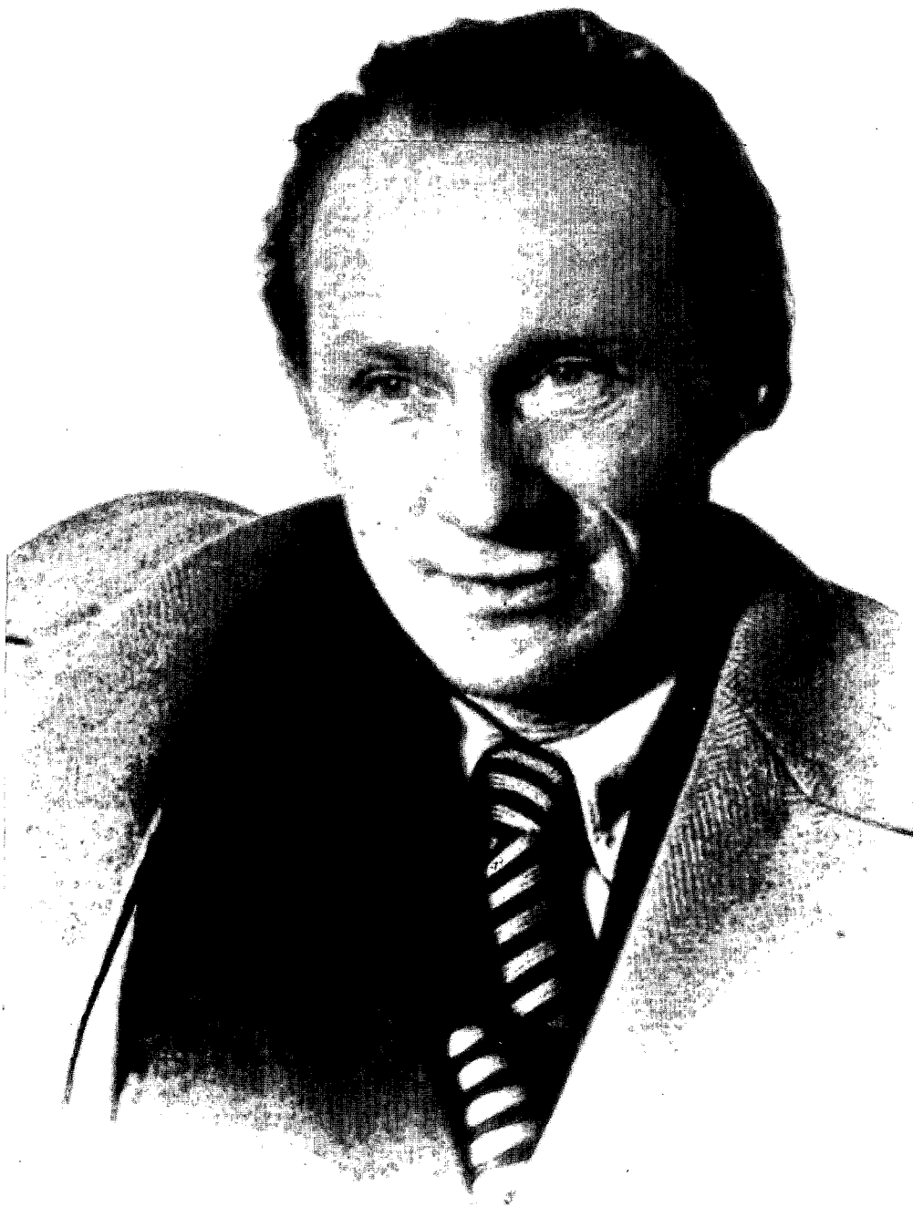
Ernst Busch, 1900-1980 (Ernst Busch, Eine Biographie in Texten, Bildern und Documenten)