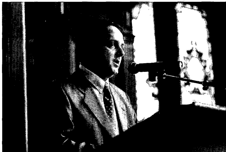
Senator Geert Van Goethem