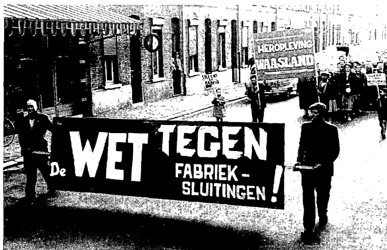
Betoging te Sint-Niklaas in 1959