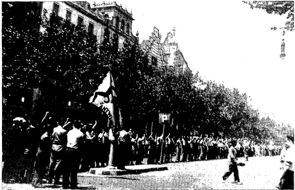
De Belgische delegatie op de Ramblas in Barcelona met de vlag van de Antwerpse Joodse Arbeidersportklub (JASK)