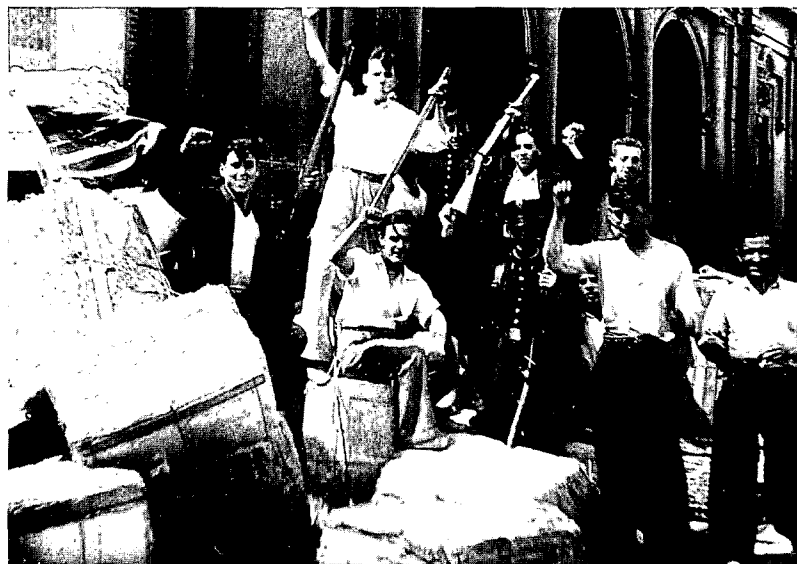
"Arbeiders wapent u"

liederen gezongen (93) . Enkele Antwerps-joodse sportlui bleven achter om in de milities te vechten. In feite waren ze meegereid om zich definitief in Spanje te vestigen, maar ze engageerden zich in de strijd (94) . Samen met andere sportlui behoorden zij tot de eerste internationale vrijwilligers in de Spaanse Burgeroorlog.