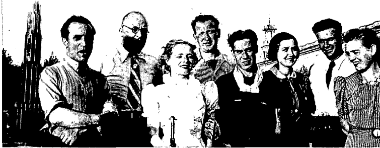
De Belgen waren gekomen om deel te nemen aan sportwedstrijden...

Franco. In Barcelona slaagden arbeidersmilities er relatief vlug in de stad onder controle te krijgen. Maar door straatgevechten en aanvallen van volkswoede op kerken en kloosters - de geestelijkheid steunde Franco's revolte - kon van een Volksolympiade geen sprake meer zijn.