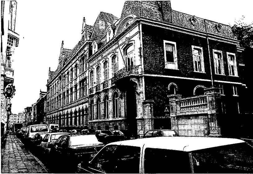
De Lamori- nièrestraat met rechts het nieuwe gebouw van AMSAB- Centrum Antwerpen

verzameling. Het kwam echter nooit tot een publicatie en in 1985 eindigde de geschiedkundige opdracht van het CESCO. Het documentatiebestand ervan bevat dossiers die betrekking hebben op zowat alle takken van de socialistische beweging te Antwerpen. In 1989 kwam het archief van de in Antwerpen belangrijke Centrale der Boek- en Papiernijverheid onder onze hoede, met daarin onder meer de originele stichtingsakte uit 1856 en reeksen verslagboeken vanaf 1901.