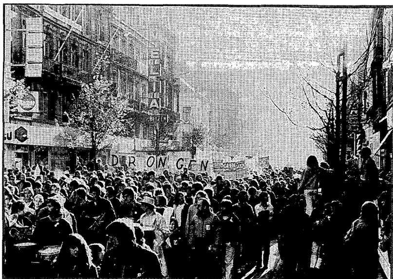
De wijze waarop VAKA in de jaren '80 mobiliseerde voor de rakettenbetoging is wellicht het beste voorbeeld van de manier waarop succesvolle mobilisatie verloopt in Vlaanderen

Er zijn vijf elementen die mee deze moeilijke verhouding kunnen verklaren. Ten eerste stellen we vast dat de netwerken waaruit de nieuwe sociale bewegingen rekruteren veel meer verwantschap vertonen met de christelijke zuil dan met de socialistische. Ten tweede is er een zekere ideologische geslotenheid vanwege de socialistische partij, die niet altijd open stond voor nieuwe stromingen en ideeën. Ten derde zien we dat in een aantal opzichten de christelijke zuil blijkbaar meer vrouwen kan rekruteren, hoewel deze zuil zich zeker niet kenmerkt door een feministisch gedachtegoed. Ten vierde is de inhoudelijke verwantschap tussen 'oud links' en 'nieuw links' niet zo hecht als de theoretische literatuur laat uitschijnen. Een vijfde en meer omvattende mogelijke verklaring ten slotte is, dat we hier te maken hebben met het structurele probleem van de ontubbeling van links en rechts. De nieuwe breuklijn vormt een kloof tussen de links-libertaire aanhangers van de nieuwe sociale bewegingen, en de traditionele achterban van de socialistische zuil.