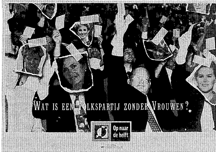
Bij de CVP zorgen organisaties als Vrouw en Maatschappij ervoor dat vrouwelijke kandidaten op externe steun kunnen rekenen bij de lijstvorming (KADOC)

thema's, maar dit vertaalde zich ook in een relatief groot aantal vrouwelijke verkozenen. Nu kan men bedenkingen hebben bij het feministische gehalte van sommige van deze verkozenen, maar het feit dat er zo weinig vrouwelijke parlementsleden waren bij de (B)SP bemoeilijkt in elk geval de communicatie met de vrouwenbeweging. In de praktijk stellen we immers vast dat mannelijke politici geen belangstelling aan de dag leggen voor feministische thema's (21) . Een mogelijke uitzondering hierop is de strijd voor de legalisering van abortus, waar mannelijke politici zich wel profileerden, maar dat werd soms eerder geïnterpreteerd als een strijdpunt tussen vrijzinnigen en katholieken, dan als een strijd om vrouwenrechten. Binnen de BSP is er eigenlijk alleen het voorbeeld van Piet Vermeylen, die zich uitdrukkelijk een feminist noemde (22) . Dat uitte zich onder meer in het feit dat hij als minister van Onderwijs de coëductie in het rijksonderwijs veralgemeende. Maar andere mannen hadden en hebben blijkbaar weinig belangstelling voor wat ze beschouwen als 'vrouwenonderwerpen'. Uit ervaringen in andere landen blijkt dat de vrouwenbeweging bij haar lobbywerk vooral een beroep doet op vrouwen-