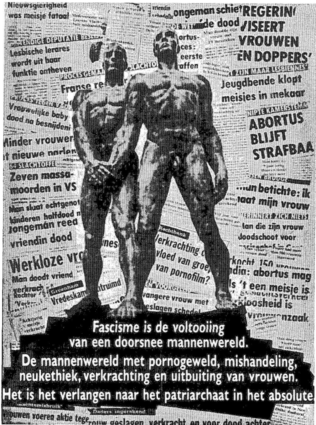
Affiche van Beekst, 1980. Deze Gentse homogroep gebruikte het beeld van de heks omdat er in oude ketterijen een verbondenheid bestond tussen heksen en 'sodomieten' tegen mannen en hun macht