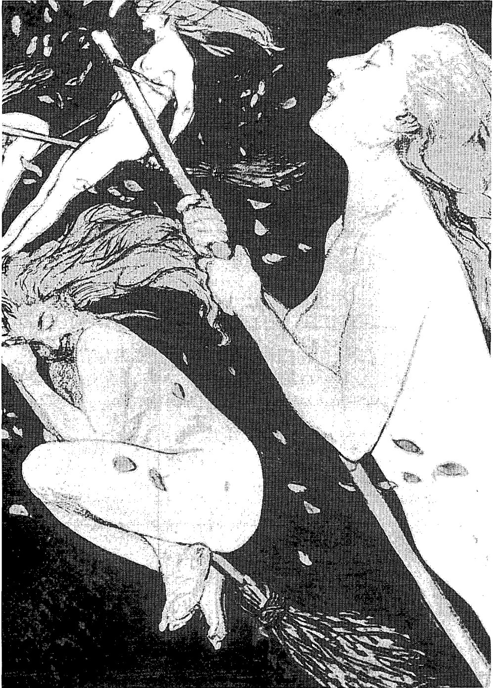
Vroeg-20e-eeuwse weergave van de Walpurgisnacht of de grote heksensabbat (Uit Duistere sekten en Zwarte kunsten, 1978)